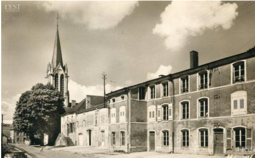
L'orphelinat situé rue de l'Église, a été fondé au XIXe siècle.

Retour sur une page de l'histoire du village et plus particulièrement sur celle du grand bâtiment, situé juste à côté de l'église : l'ancien orphelinat.