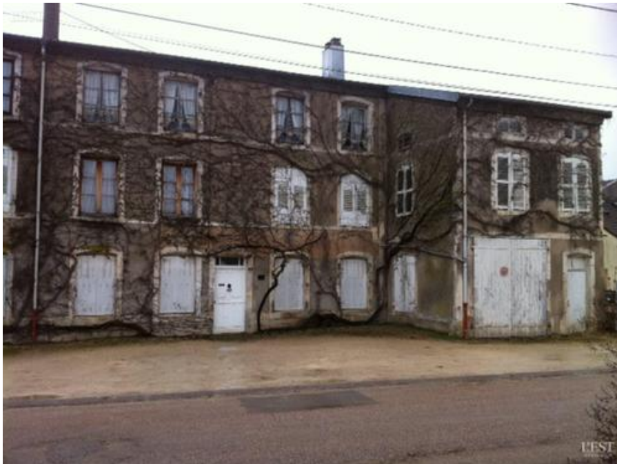
Le bâtiment a été réhabilité.

Nombre d'années d'existence de l'ancien orphelinat de Uruffe qui a compté jusqu'à 38 pensionnaires, aujourd'hui réhabilité en appartements.