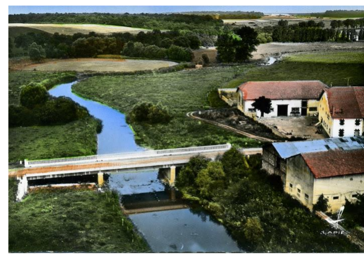
Le nouveau pont

D'azur à quinze billettes d'or, 5 – 4 – 3 – 2 – 1.