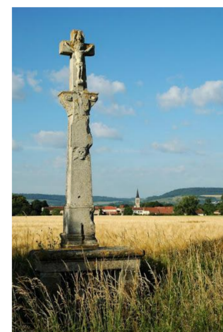
Route de Fossieux Le Calvaire

Ajoncourt est situé dans la région Lorraine, le département de la Moselle et le pays du Saulnois qui comme son nom l'indique est le pays du sel. Des sources salées lui ont apporté la richesse jusqu'à la fin de l'Ancien Régime.