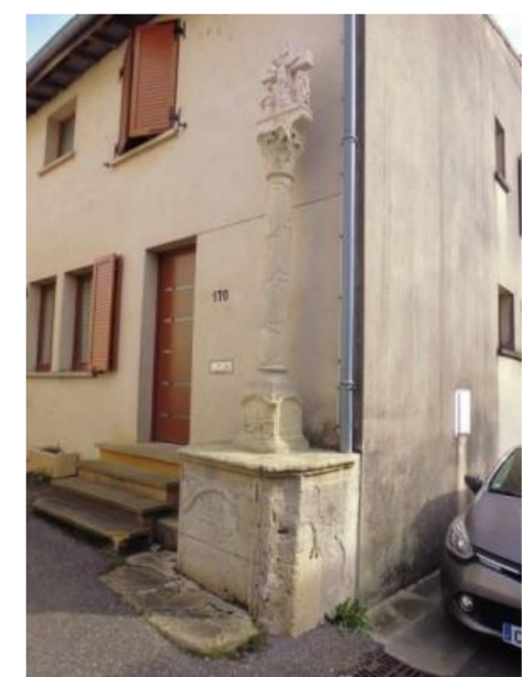
Calvaire du quartier de Pallon

Sur la colline du Rudemont (altitude 303 m), qui domine le village au nord, s'étend un site archéologique du type éperon barré qui a fait l'objet de fouilles: nombreux indices de surface éparpillés sur le plateau et sépultures néolithiques de la fin du IV e millénaire avant J.-C. dans une diaclase du rebord rocheux