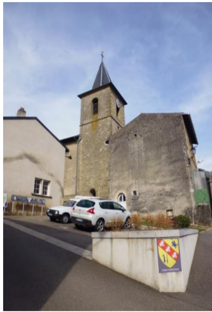
Eglise paroissiale Saint-Etienne