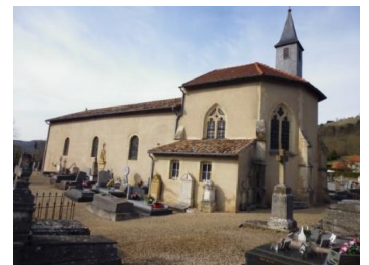
Chapelle de Pallon

Arnaville, village du département de Meurthe-et-Moselle et de la région de Lorraine, compte actuellement 621 habitants, les Arnavillois. La population avait atteint un maximum de 914 âmes au recensement de 1876, avant de redescendre à 567 en 1946, puis de croître lentement depuis. La commune s'étend sur 522 hectares ce qui représente une densité de 119 habitants/km 2 . Le territoire est traversé par le cours inférieur du Rupt de Mad jusqu'à son confluent avec la Moselle à proximité du point le plus bas du département situé à 170 m au-dessus du niveau de la mer. Le point culminant de la commune atteint l'altitude de 354 m. Un barrage a été construit sur le Rupt de Mad pour constituer une retenue d'eau alimentant la ville de Metz. Arnaville appartient à la communauté de communes du Chardon lorrain et au parc naturel régional de Lorraine. Le quartier de Pallon, situé dans la partie ouest de l'agglomération, est un ancien hameau séparé à l'origine mais rejoint par le village au début du XIX e siècle.