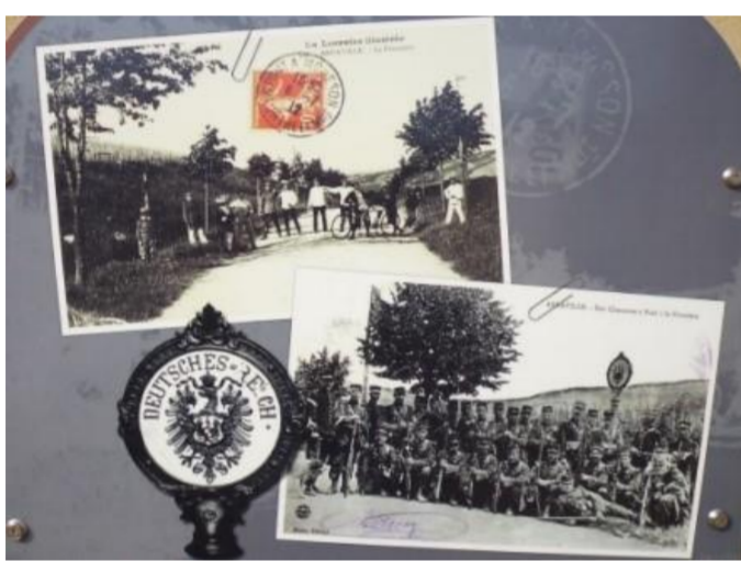
Souvenir de l'ancienne frontière

Arnaville était divisé en trois seigneuries: le ban Saint-Pierre appartenant au duc de Lorraine, le ban Saint-Gorgon à l'abbé de Gorze et le ban Saint-Vanne à l'évêque de Verdun.