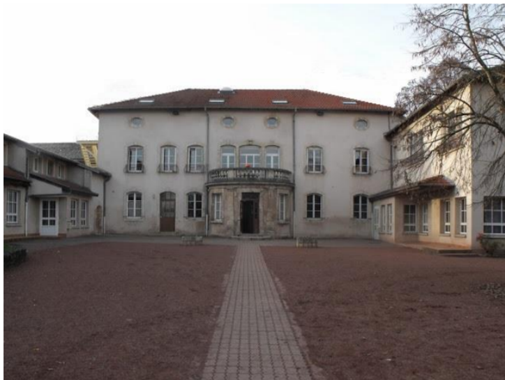
Han : Le centre

De gueules à l'émanche renversé d'argent. Ce sont les armes de l'ancienne maison de Han