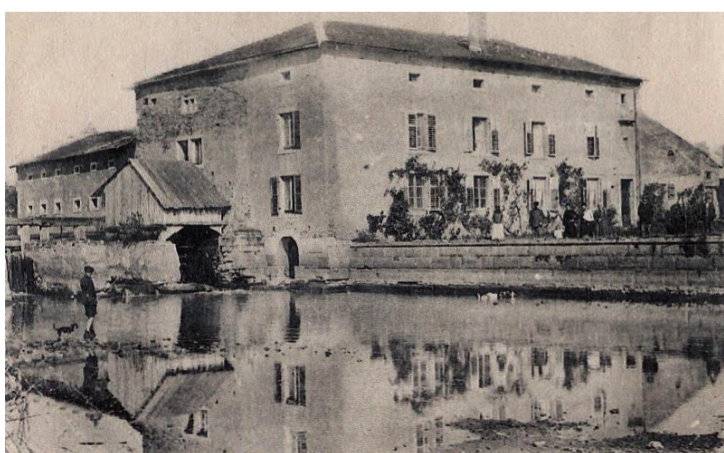
Le moulin de Chambille

La commune a été décorée de la croix de guerre avec palme 1914-1918 et croix de guerre avec étoile de bronze 1939-1945.