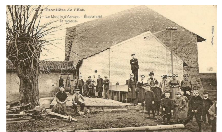
Le moulin d'Arraye