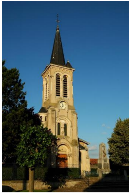
Arraye : Eglise S' Etienne