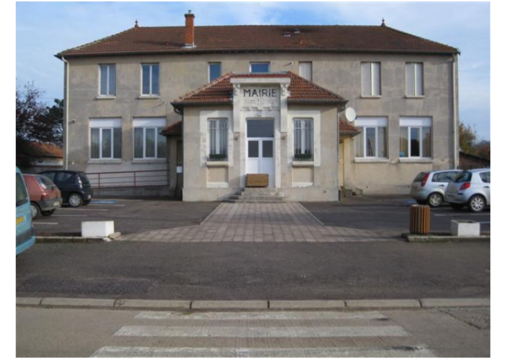
Arraye : La mairie

De gueules à l'émanche renversé d'argent. Ce sont les armes de l'ancienne maison de Han