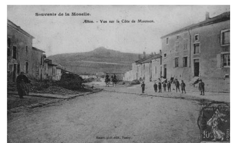
Vue sur la côte de Mousson