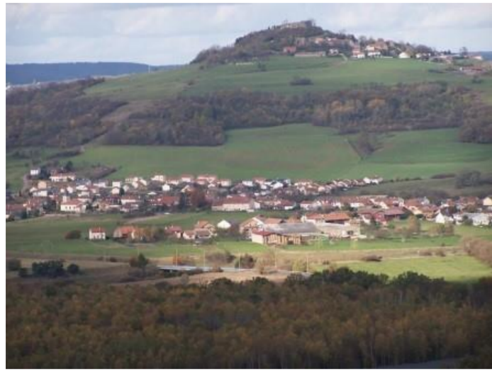
Atton dominé par la colline de Mousson