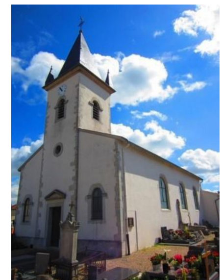
Eglise S t Germain