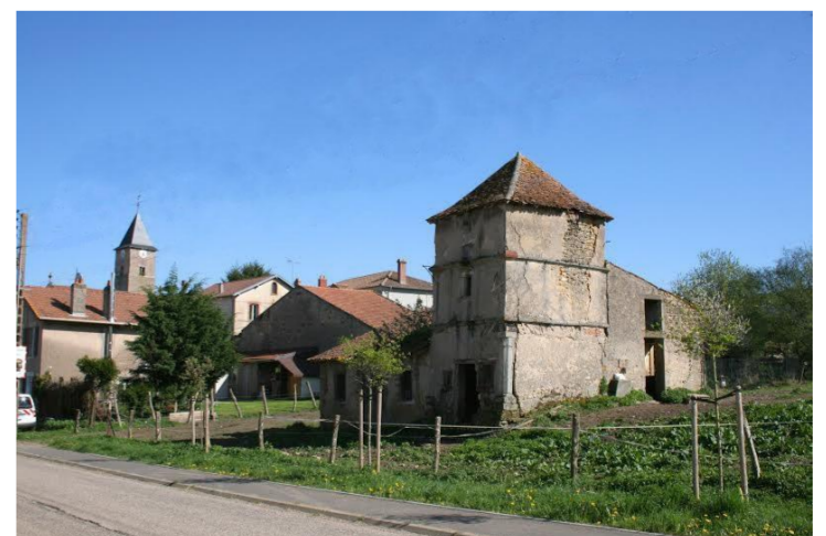
L'entrée du village en venant de Morey