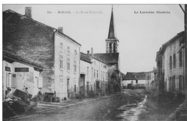
La route nationale