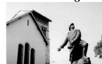
Le monument aux morts (ancien emplacement)