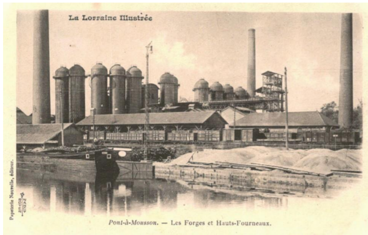
Les forges et Hauts-Fourneaux

D'or à une usine à deux cheminées de sable ouverte et ajourée d'argent, accostée de deux éclairs d'azur issant des flancs de l'écu, soutenue de trois anneaux de sable mis en fasce, le tout accompagné en chef d'un écu de gueules chargé d'une croix de Lorraine d'argent.