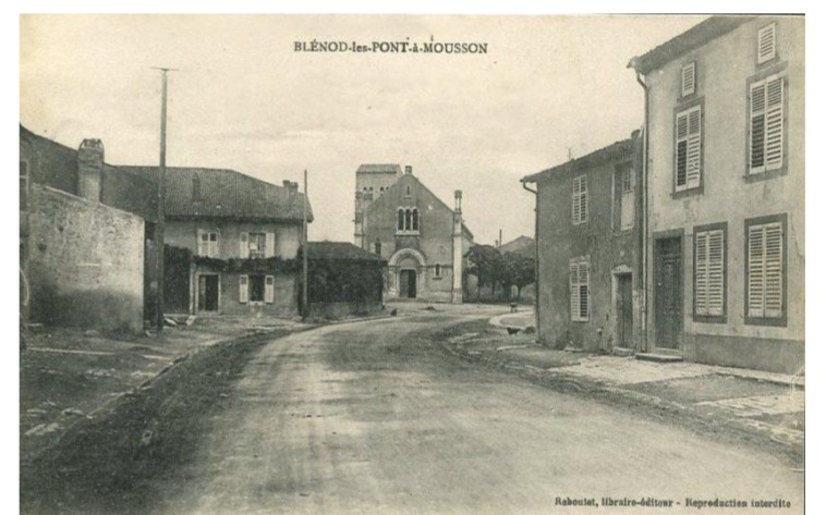
Rue Victor Claude

Blénod les Pont à Mousson est un village français, situé dans le département de Meurthe-et-Moselle et la région de Lorraine. Ses habitants sont appelés les Bellédoniens et Bellédoniennes