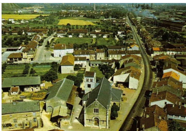
Vue aérienne, l'église