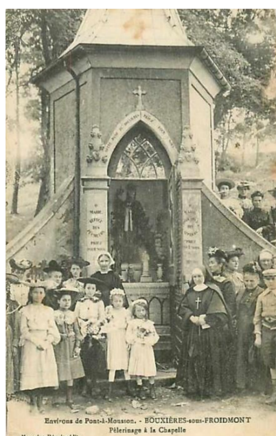
Pèlerinage à la chapelle

"A vrai dire, depuis 783 jusqu'en 1789, BOUXIERES n'a pas été soustrait un seul instant de l'autorité seigneuriale des abbés de Saint-Arnould. Depuis les temps les plus reculés de l'histoire, jusqu'en 1870, le village n'a cessé de suivre le sort politique de METZ, sa métropole. Il fut en environ cinq siècles sous la domination romaine (37 avant J.C. à 310 après J.C. ) ; environ 5 siècles sous les dynasties franques des mérovingiens et des carolingiens (500 à 985) ; environ 5 siècles sous l'influence plus ou moins directe de l'empire d'ALLEMAGNE (985 à 1552) ; et de nouveau trois siècles environ sous la domination française (1552 - 1870). En 1870, le village échappa à l'annexion en vertu de cette circonstance particulière, qu'il faisait partie du département de la Meurthe (aujourd'hui Meurthe et Moselle) et s'il plut au vainqueur de s'arrêter sur ce point du département de la Moselle.