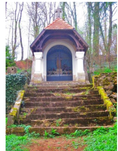
Chapelle de pèlerinage Notre-Dame-du-Froidmont

D'argent chapé d'azur au rameau de buis de sinople mis en pointe