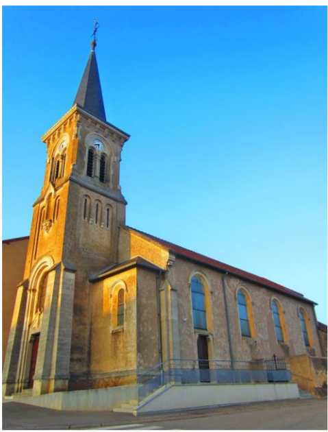
Eglise de la nativité de la vierge