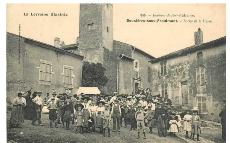
Sortie de la messe

Arrondissement: Nancy Canton: Pont-à-Mousson Code Insee: 54091 Code postal: 54700 Population: 301 habitants Superficie: 7,71 km 2