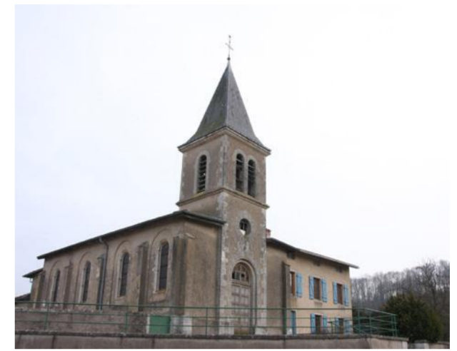
Église de la Nativité-de-la-Vierge

D'argent à la montagne à six coupeaux de sinople environnée à dextre d'un M majuscule couronné d'azur et à senestre d'une faux en pal de même