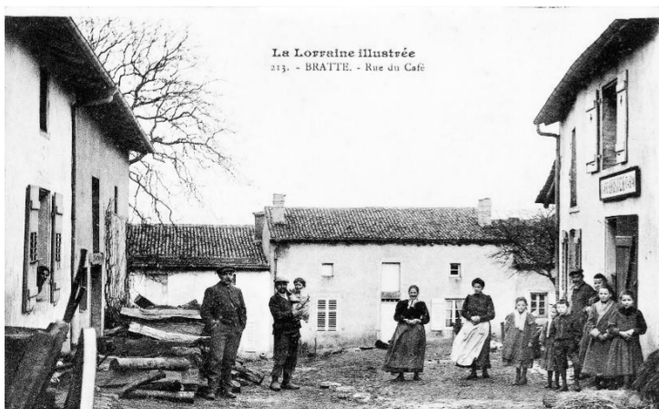
Rue du café

Le livre des familles du village comprend la retranscription de 1786 individus, 609 unions et 361 noms