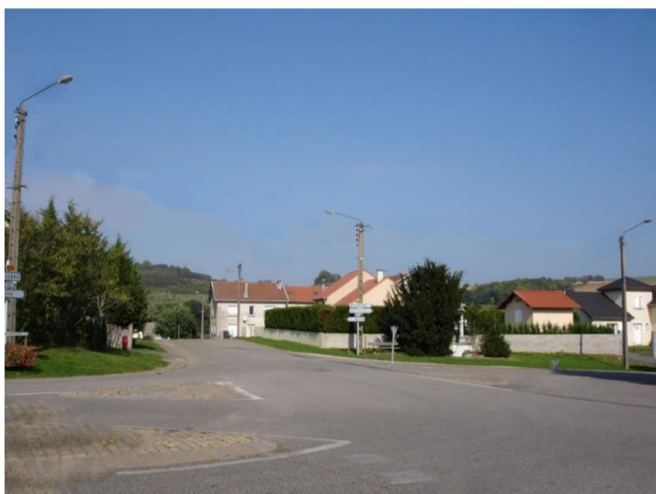
Rue du village

Bratte est situé sur une colline entre le val de Faulx et le val Saint Marie, symbolisé ici par un M. Le blason est utilisé par la mairie depuis 1986.