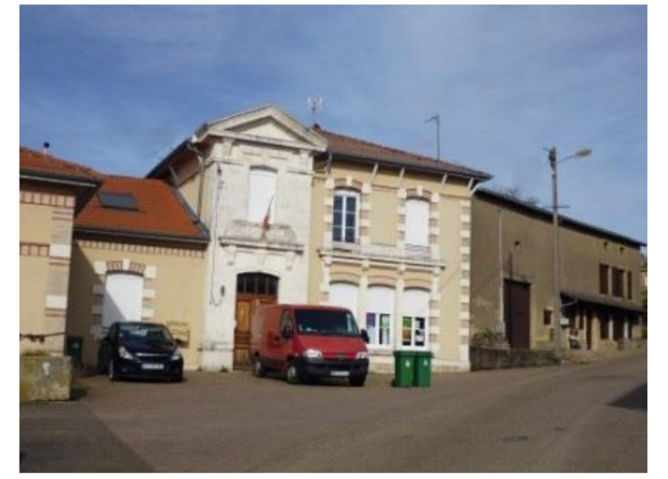
Mairie, rue Edmond-Henry

D'argent à trois fasces de gueules, accompagnées de six mouchetures d'hermine de sable posées 3-2-1, au chef de gueules chargé de trois annelets d'or.