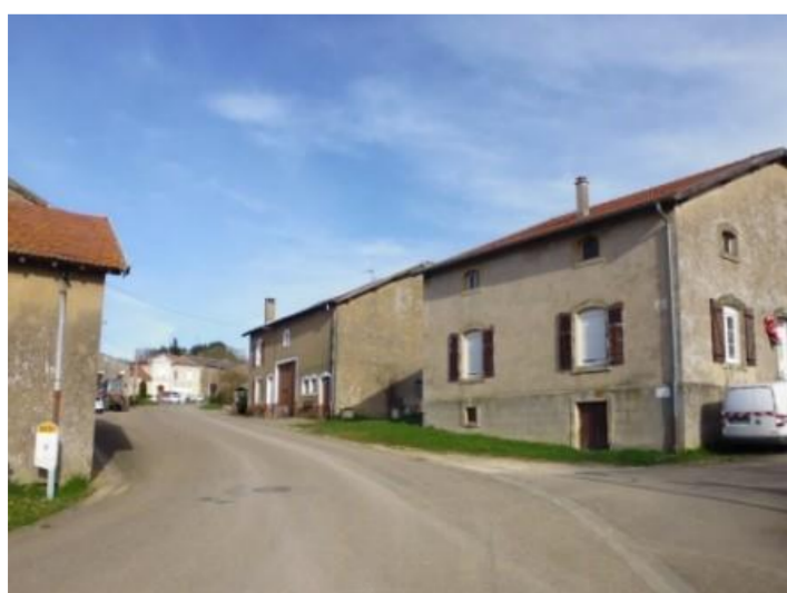
Maisons reconstruites vers 1920