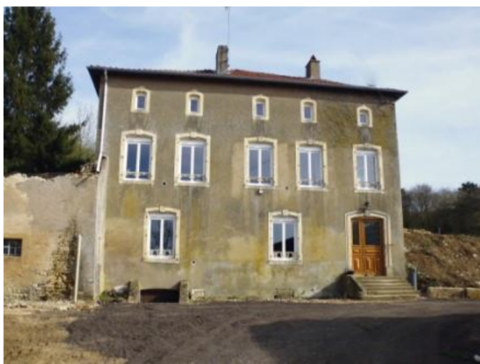
Maison du XVIII e siècle, rue Haute

Il s'agit des armes de l'ancienne famille de Gourcy qui posséda la seigneurie de Charey de 1571 à 1789 et dont la devise était: «Loyal, Antique, Vayant (vaillant)».