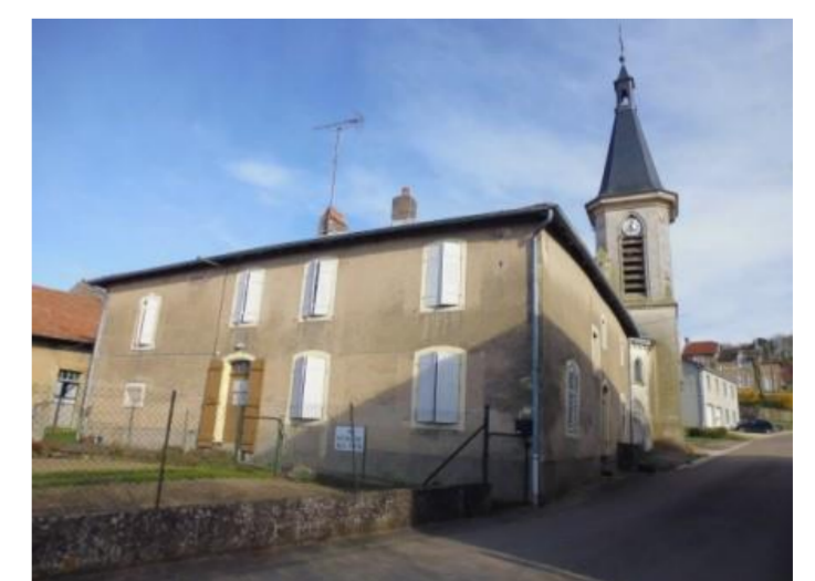
Maison épargnée par la guerre 1914-18