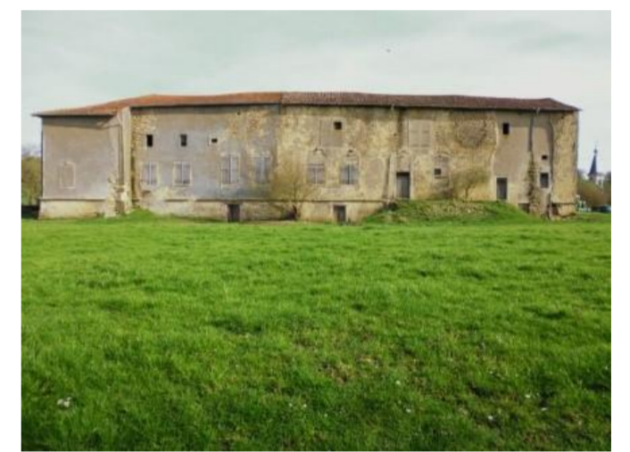
Vestiges du château

Arrondissement: Toul Canton: Thiaucourt-Regniéville Le Nord-Toulois (2015) Code Insee: 54 119 Code postal: 54 470 Population: 75 habitants Superficie: 9,31 km 2