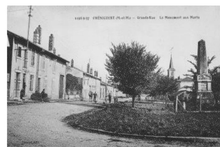
Monuments aux morts