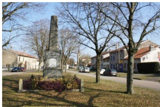
Monument aux morts