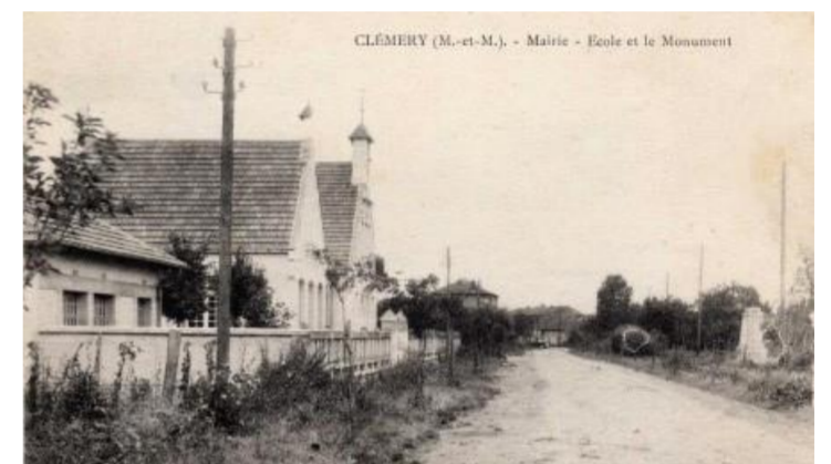
Mairie - Ecole - Monument

Clémery est un petit village français, situé dans le département de Meurthe-et-Moselle et la région de Lorraine. Ses habitants sont appelés les Clémériens et les Clémériennes et ont pour surnom ... les loups.