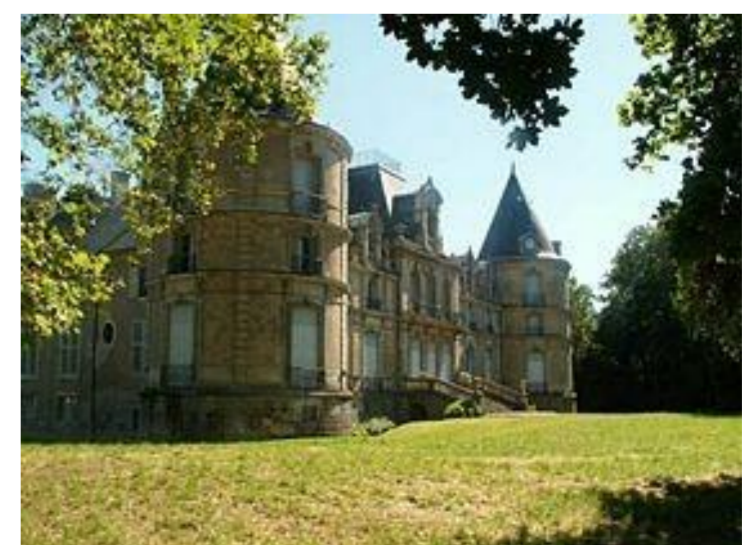
Château de Clémery

Une maison forte est édifée par le comte de Bar avant 1406, à la place de la maison d'exploitation appartenant à l'abbaye de Saint-Symphorien (évêché de Metz). Elle est vendue à Antoine Warin (duché de Lorraine) en 1488. Elle conserve son allure médiévale jusqu'à la fin du XVIII e siècle, puis subit des transformations successives, dont la plus importante, en 1861, lui donne le style Second Empire.