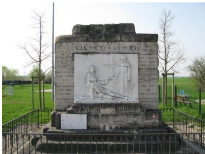
Monument aux morts

Ce sont les armes des anciens seigneurs de Clémery. Cette famille d'ancienne chevalerie portait le nom du lieu et s'éteignit au XVI e siècle. Par la suite la seigneurie passa dans la famille Du Hautoy pour laquelle la terre de Clémery fut érigée en marquisat en 1728.