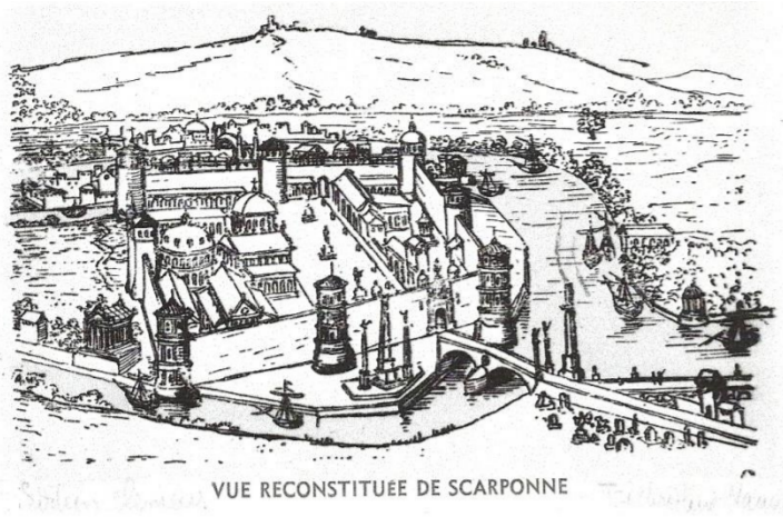
Vue reconstituée de Scarponne