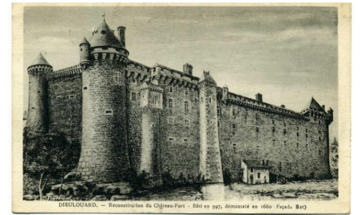
Reconstitution du Château Fort

De gueules à la crose épiscopale d'or, mise en pal, accostée de deux épées d'argent posées de même la pointe en bas.