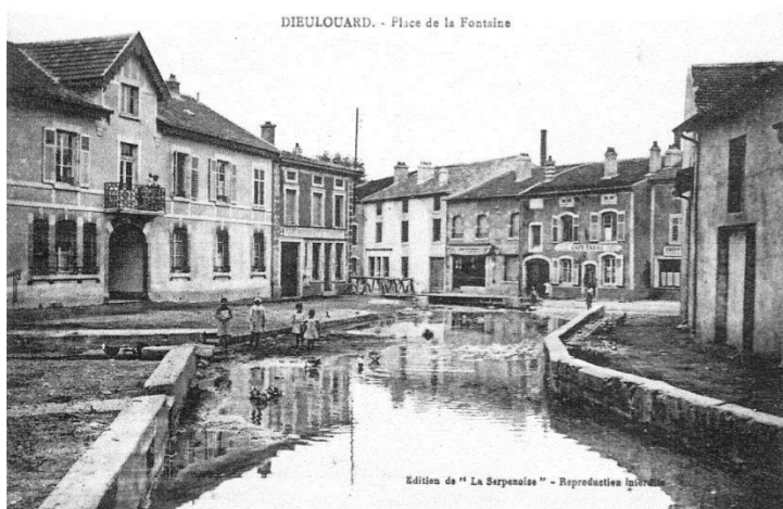
Place de la fontaine

Rue Maurice Geogin (maisons détruites 1914 – 1918)