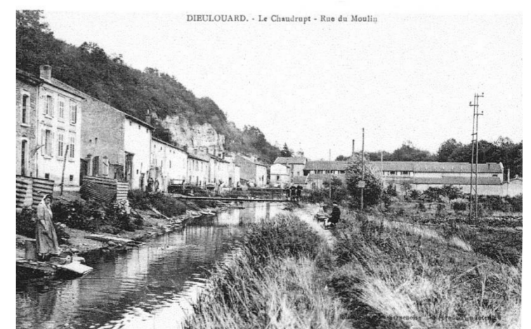
Le Chaudrupt - rue du Moulin