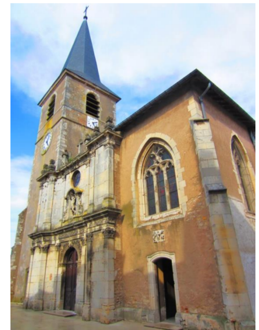
Eglise Saint Sébastien

Arrondissement: Nancy Canton: Dieulouard Entre Seille-et-Meurthe (2015) Code Insee: 54157 Code postal: 54380 Population: 4545 habitants Superficie: 17.69 km 2 Décustodiens, Décustodiennes Scarponais, Scarponaises