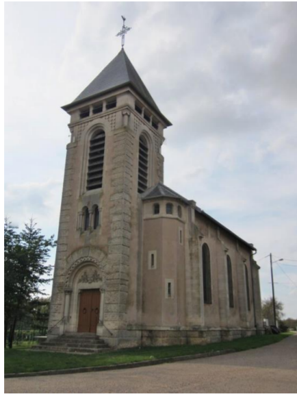
Eglise Saint Martin