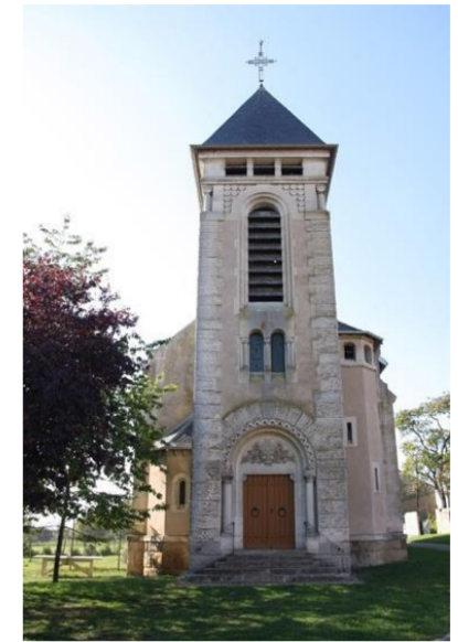
Eglise Saint Martin

D'azur semé de croix recroisetées au pied fiché d'or chargé de deux bars de même, l'écu chapé d'or à deux taux de sable.