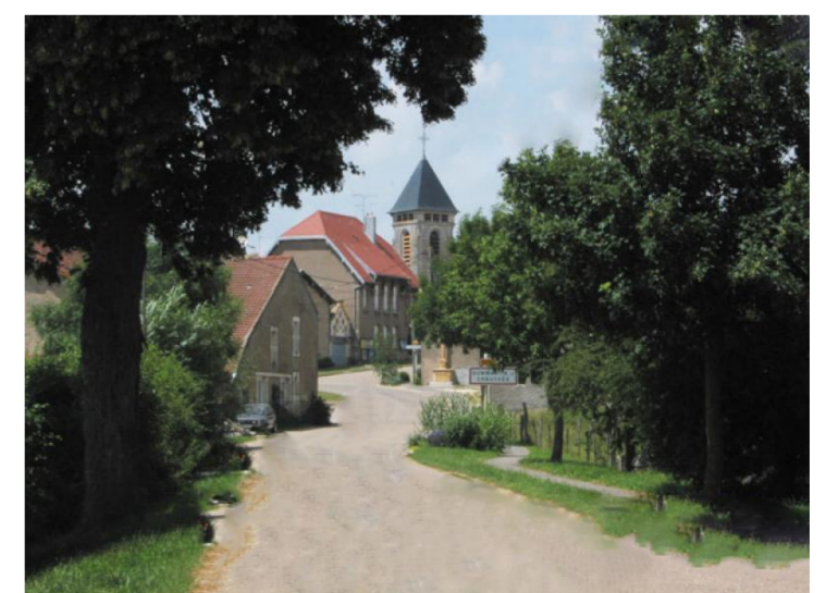
L'entrée du village