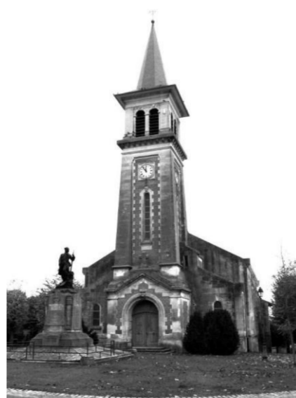
Eglise Saint Christophe