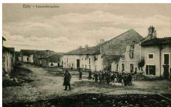
Rue du village

Eply, terre lorraine, a trois rivières, représentées par les pals, deux tours et un bois symbolisé par les arbres. Ce blason est utilisé depuis 1976.