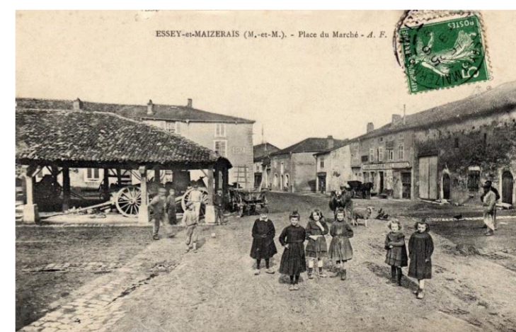
Place du marché