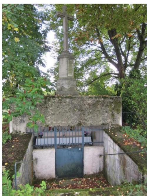
Oratoire Saint Gribier

Essey-et-Maizerais est composé du bourg principal, Essey (autrefois dénommé "Essey-en-Woëvre") et du hameau de Maizerais (détruit lors de la Première Guerre mondiale ). Seuls quelques bâtiments d'habitation et de ferme et une chapelle subsistent encore à Maizerais (situé au sud-ouest du bourg principal).