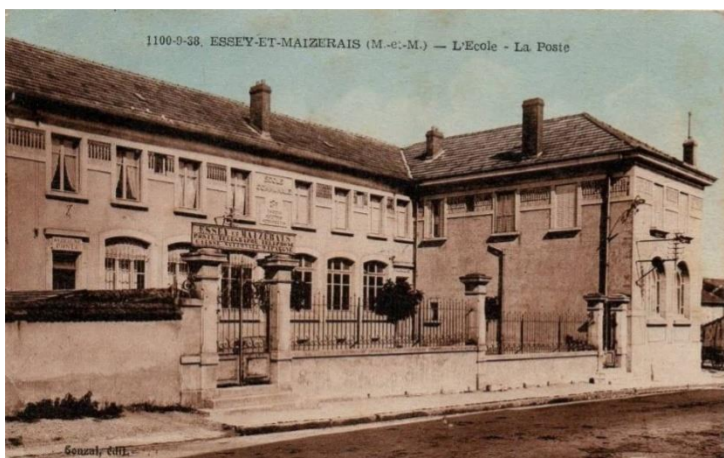
L'école – La poste