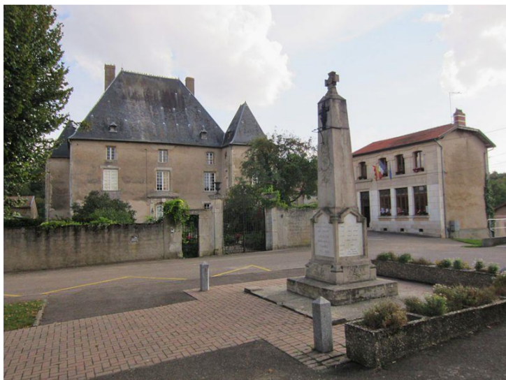
La place avec le château, la mairie, et le monument aux morts