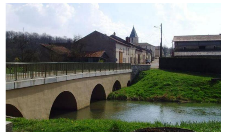
Pont sur le Rupt-de-Mad