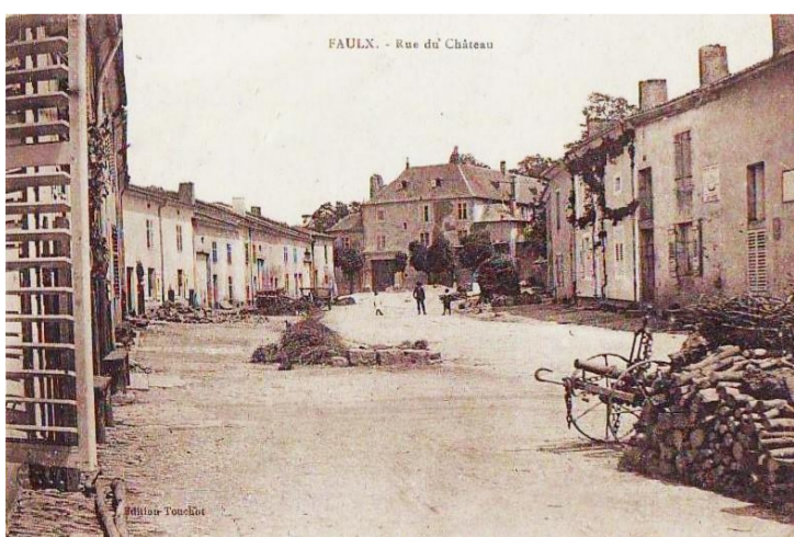
Rue du Château