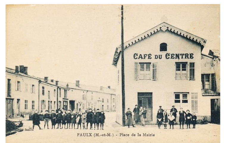
Place de la Mairie