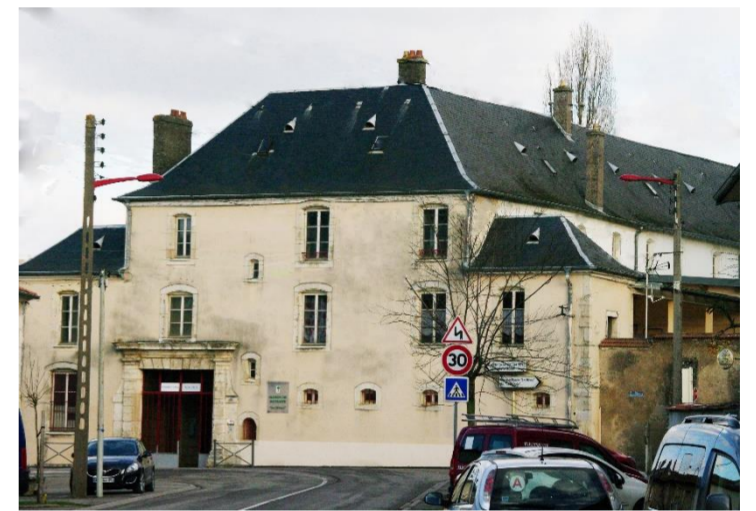
Maison de retraite

Faulx fait partie de l'intercommunalité de la Communauté de communes du Bassin de Pompey.