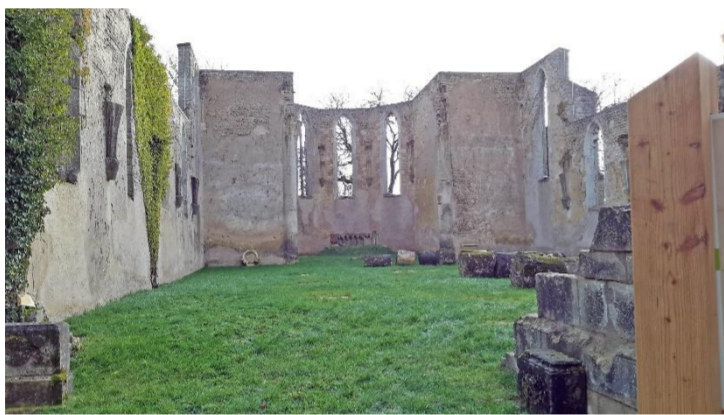
Eglise Saint-Etienne d'avant 1914

Flirey se trouve au croisement des routes reliant Saint-Mihiel à Pont-à-Mousson, et Toul à Thiaucourt (la croix). Saint Étienne est patron de la paroisse (les cailloux). Flirey était appelé anciennement Flirey-en-Haye. Les hêtres sont au nombre de quatre pour symboliser les quatre forêts encadrant Flirey: bois de Mort Mare, bois du Jury, bois de la Hazelle et bois de la Voisogne.