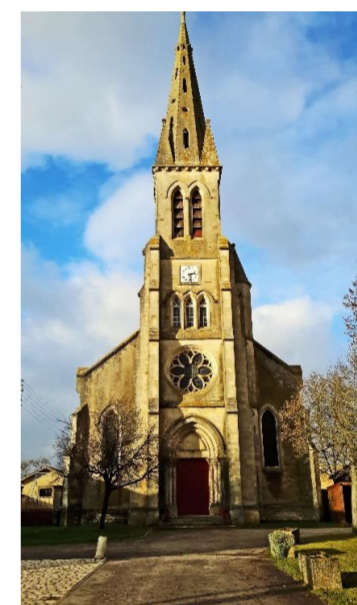
Eglise Saint-Etienne actuelle

Flirey est une commune située dans le département de Meurthe-et-Moselle et dans le parc naturel de Lorraine. Les habitants de la commune de Flirey sont appelés les Fliretins, Fliretines.