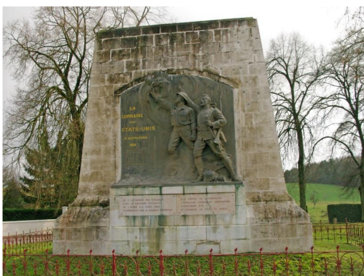
Monument aux morts