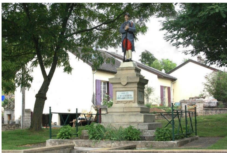
Monument aux Morts Guerre 1914/1918