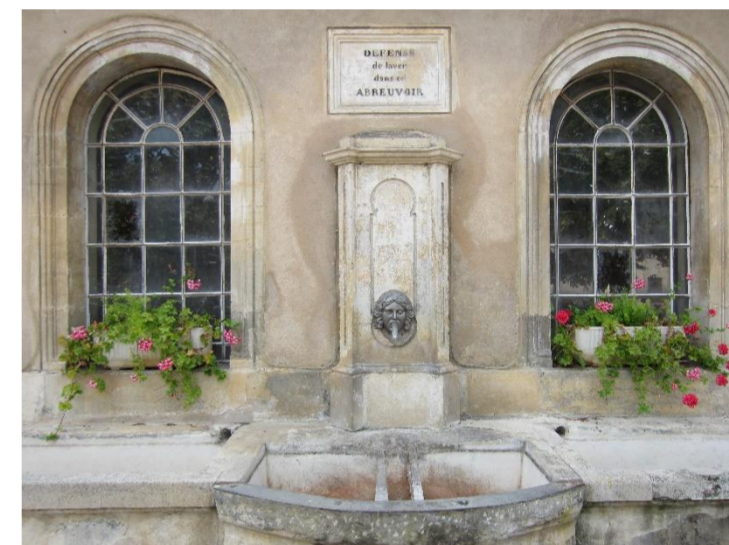
Le lavoir (vue extérieure)