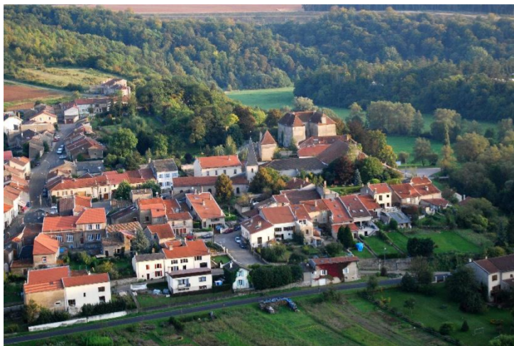
Vue du village