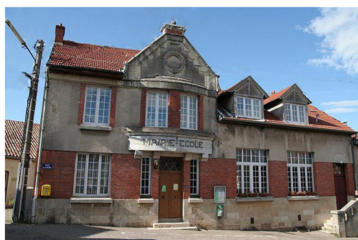
Mairie - Ecole

Jaulny est un petit village français, situé dans le département de Meurthe et Moselle et la région de Lorraine. Entouré par les communes de Thiaucourt-Regniéville, Rembercourt sur Mad et Viéville en Haye. Jaulny est situé à 24 km au Sud-ouest de Montigny lès Metz, la plus grande ville à proximité.