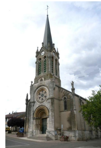
Eglise Saint Aubin

d'argent à la croix de gueules, cantonné de quatre Taus de sable et chargé en abîme d'un livre ouvert d'argent.