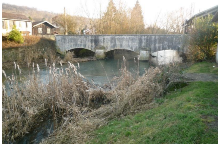
Le ruisseau d'Esch