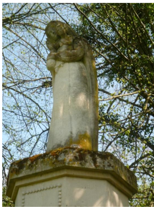
Ste Vierge protectrice de la commune

Le livre indique que les papeteries de Jézainville travaillaient pour l'université de Pont à Mousson, installée dans cette même ville de 1572 à 1769.