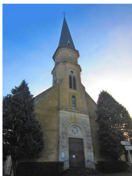
Eglise Saint Gengoult