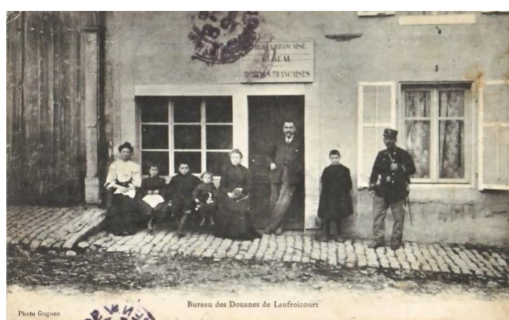
Bureau des douanes