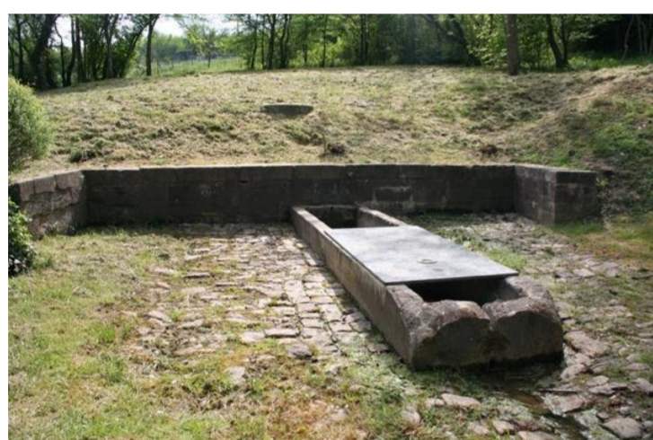
Fontaine Saint Gengoult