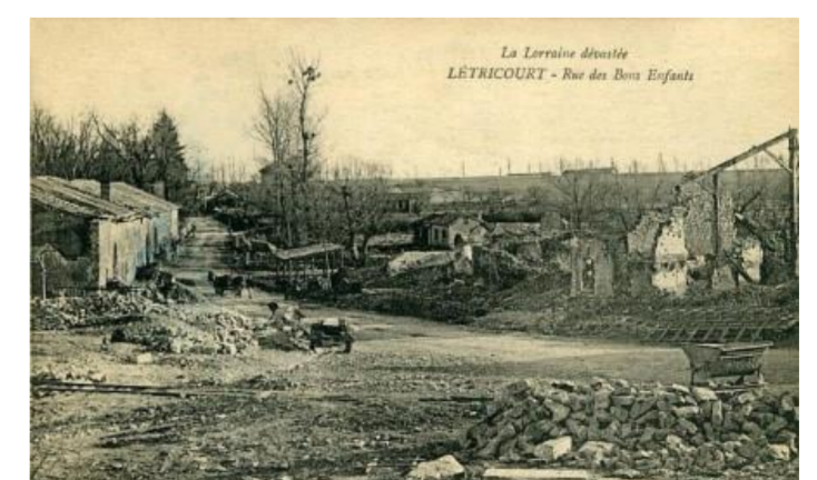
Rue des Bons enfants