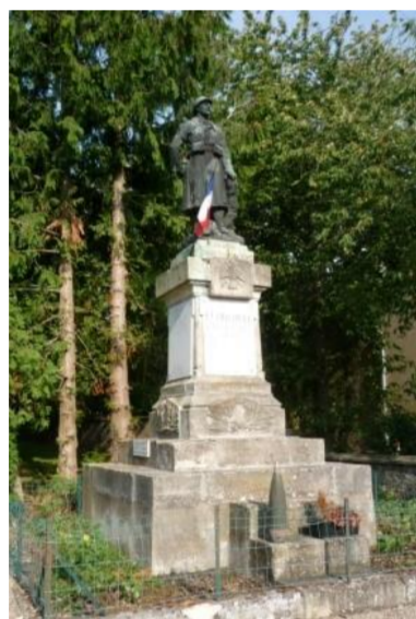
Monument aux morts

Ce sont les armes des seigneurs de Létricourt d'ancienne chevalerie. Ce modeste lignage s'éteignit au début du 14 e siècle et la seigneurie passa dans diverses maisons. Certains auteurs indiquent un lion au lieu d'un léopard. Il est préférable de choisir le léopard afin de différencier le blason de celui d'Aulnois qui contient un lion.