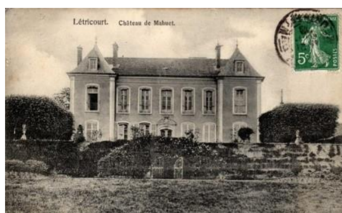
Château de Mahuet