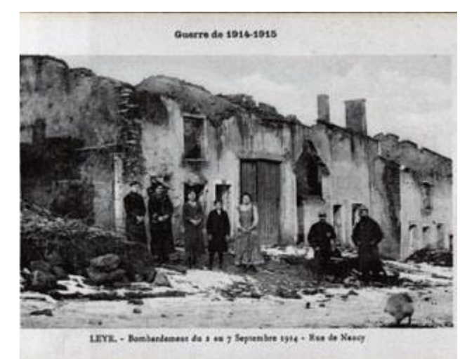
Rue de Nancy