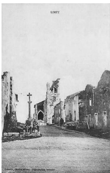
Limey en ruine

Le livre des familles de Limey-Remenauville comprend la retranscription de : 5409 individus, 881 patronymes, 1864 unions.