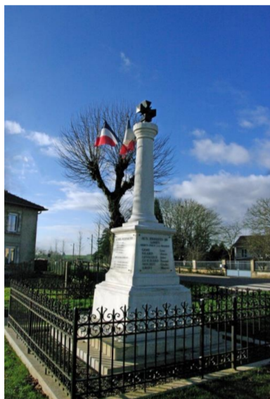
Monument aux morts

Il s'agit d'armes parlantes. En effet, Dauzat donne comme étymologie au nom de Limeil, Limeuil, Limey : la clairière des ormes. L'orme entouré d'une bordure se trouve dans une clairière.