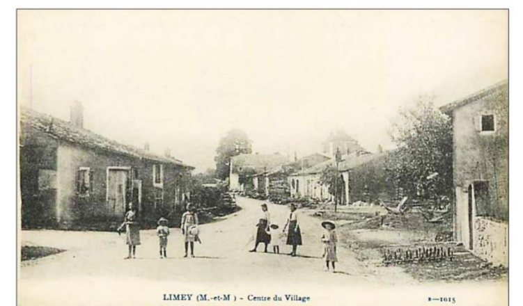
Centre du village

Villages situés à proximités : Fey-en-haye (5,2km), Martincourt (5,8km), Lironville (2,2km), Mamey (4,7km) Domèvre-en-Haye (7km) Montauville (6km) Adresse de la Mairie 5, rue St Jacques 54470 Limey Téléphone :03 83 84 31 64