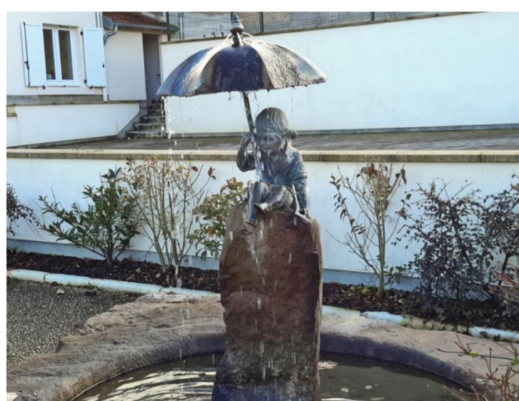
La petite fille au parapluie

Les quatre lions indiquent que les Beauveau étaient seigneurs du lieu (émaux inversés). La colombe avec la sainte ampoule symbolise Saint Remi, patron de la paroisse