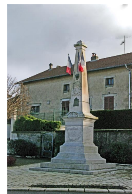
Monument aux morts

Arrondissement: Toul Canton: Thiaucourt-Regniéville Le Nord-Toulois (2015) Code postal: 54470 Code Insee: 54317 Population: 116 habitants (2009) Superficie: 899 hectares Altitude: 217 à 319 mètres