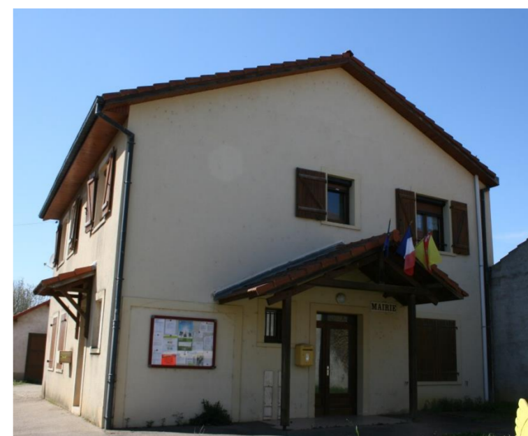
La salle polyvalente

De gueules à cinq roses d'argent, boutonnées de gueules et ordonnées en sautoir (1986)