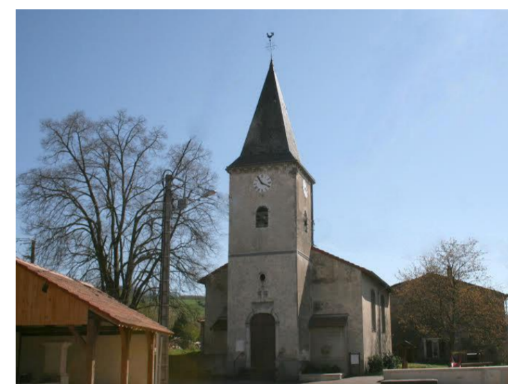
L'église de l'Assomption

Le village de Lixières est situé au pied du Mont Toulon. Celui-ci s'élève sur plus de 100m et offre un vaste panorama, du pays messin jusqu'aux côtes de Saverne.