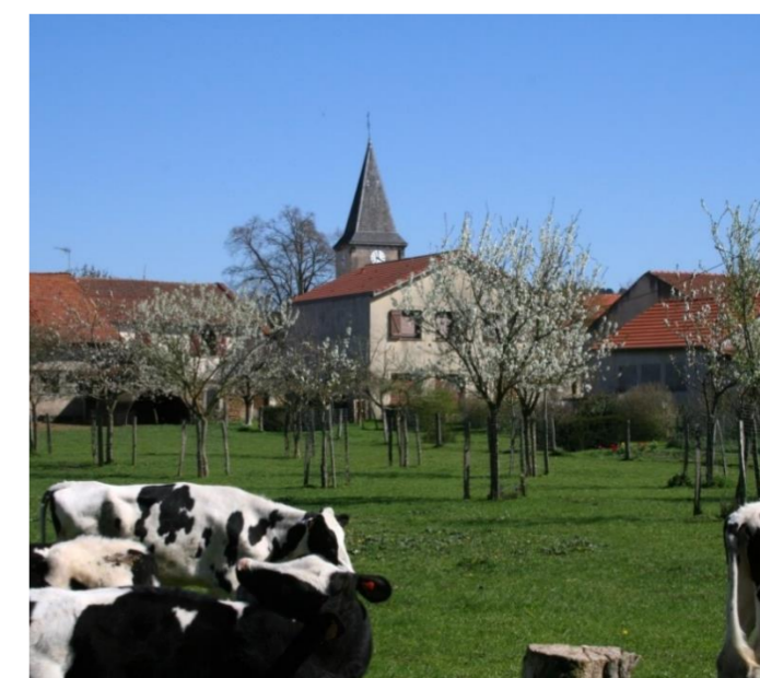
Vue de Lixières

Le nom primitif du village serait peut-être Licsarias, endroit où poussent les carex. Lixières est précisément près du ruisseau de Grève qui se jette dans la seille.