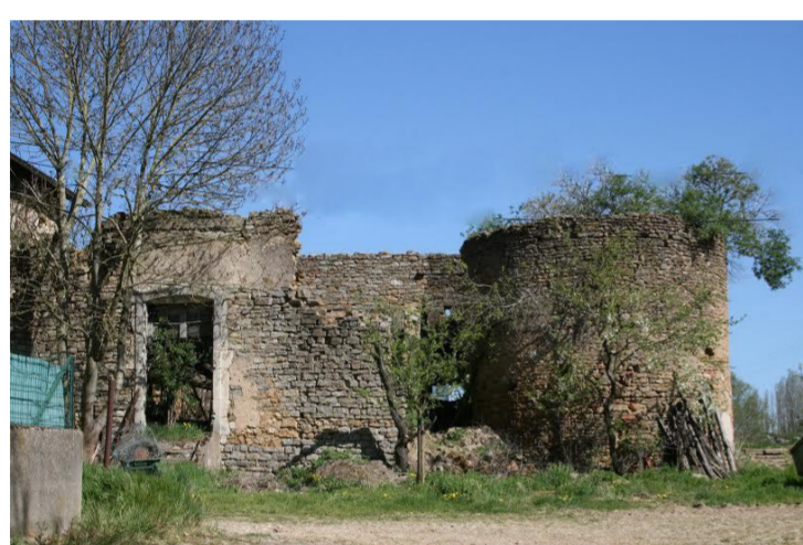
Ruines de Lixières

Les cinq roses symbolisent les cinq villages rassemblés sous le nom de Belleau, à savoir: Belleau, Lixières, Manoncourt-sur-Seille, Morey et Serrières.