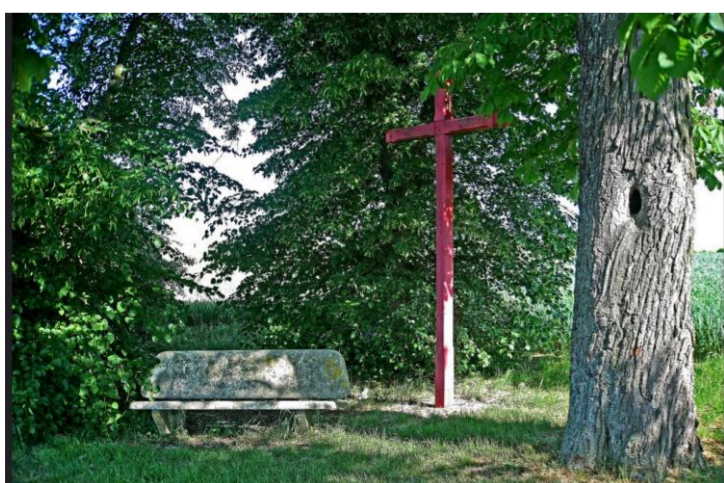
La Croix Rouge