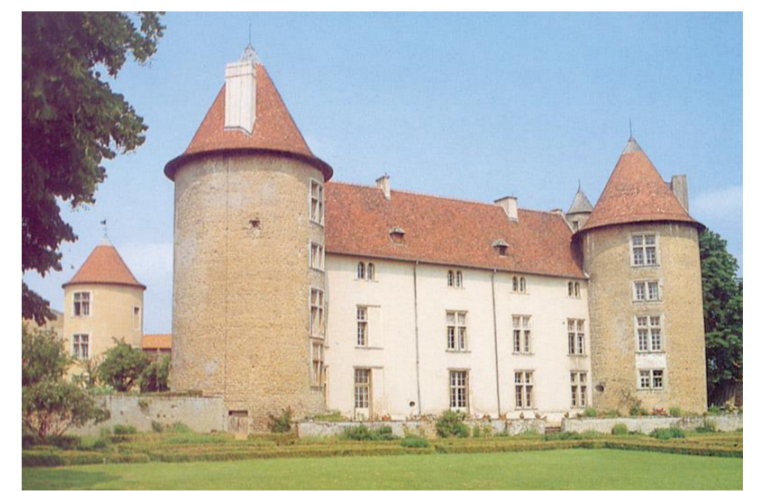
La maison forte

Mailly-sur-Seille est une commune située dans le département de Meurthe-et-Moselle. Mailly, village de l'ancienne province du Barrois était situé à l'extrême frontière de la France depuis le traité de Francfort qui mettait fin à la guerre Franco-allemande. Son territoire était borné au nord par les communes de St Jure, Ressaincourt, Secourt, Saily, à l'est par ceux de Phlin et d'Abaucourt, au sud par celui de Nomeny, et à l'est par celui de Raucourt. Mailly était une commune essentiellement agricole, mais le sol étant presque partout argileux, la culture y était très difficile. La Crevée, source qu'une ancienne tradition populaire montrait hantée par les fées ! Le ruisseau du Feuillu (Fouyeu ou Fouyu) prenait sa source sur le territoire de St Jure, se creusait un lit souterrain pour sortir à 800 mètres plus loin sur le territoire de Mailly. Puis un petit ruisseau, La Queue de Prête, et la rivière de la Seille.