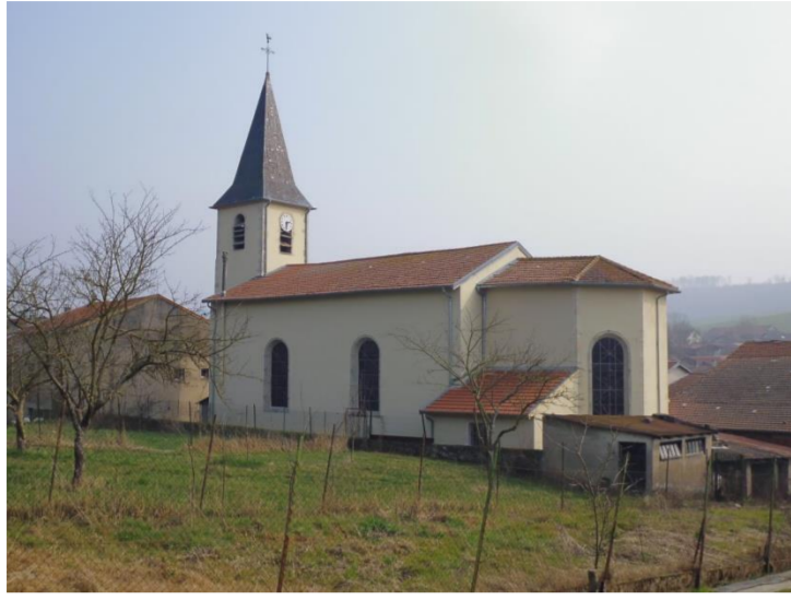
Eglise de l'Assomption