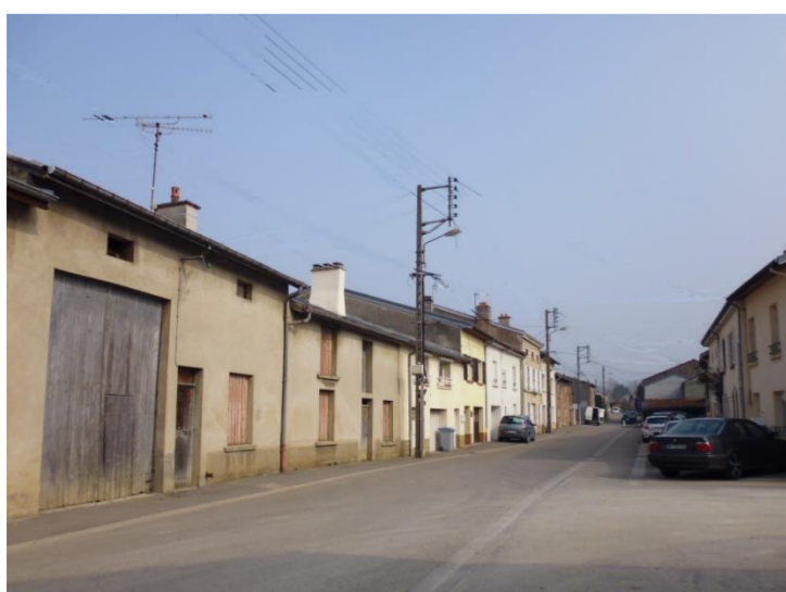
Rue de Vénézu