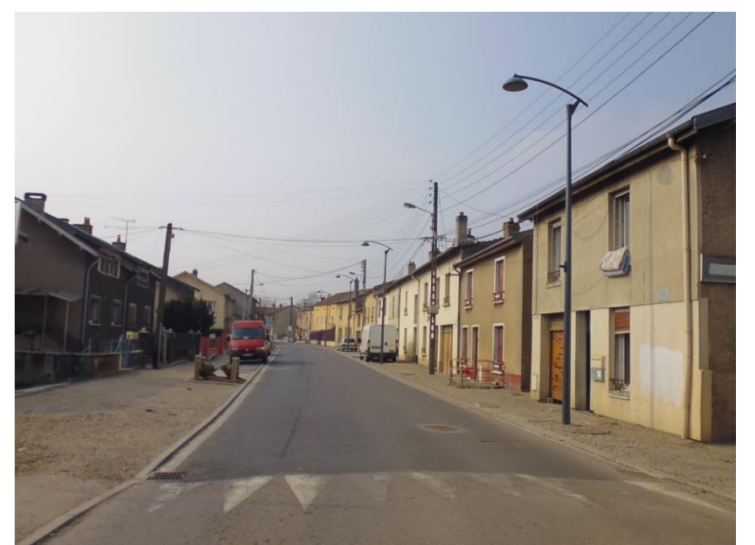
Rue de Custines