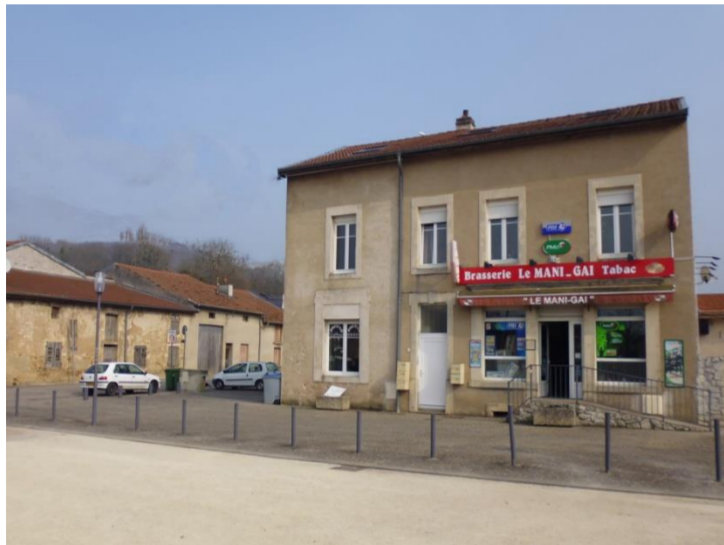
Place du 11 septembre 1944

Il s'agit des armes de la famille Collignon qui a possédé la seigneurie aux XVII e et XVIII e siècles, terre érigée en comté en 1724 pour Edmond Collignon chambellan du duc Léopold.