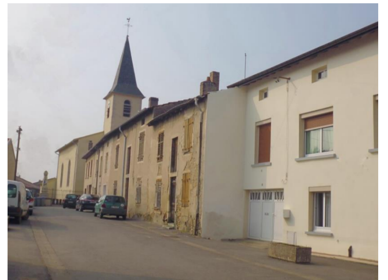
Ruelle de l'Eglise

La commune de Malleloy, située dans le département de Meurthe-et-Moselle et la région de Lorraine, s'étend sur 406 hectares pour une population de 922 habitants en 2011, ce qui représente une densité de 227 hab./km 2 . Elle comptait seulement 346 habitants en 1851 et 359 en 1954. La localité appartient à la communauté de communes du «Bassin de Pompey». Les habitants sont dénommés les Maniguets et Maniguettes. Autour de l'ancien village ont été développés trois nouveaux quartiers de maisons individuelles: lotissements du Grand-Jardin, des Encloses et de la Résidence du Parc. Sur la commune, une mine de fer a été exploitée au début du XX e siècle et, par la suite, la population a pu bénéficier d'emplois aux aciéries de Pompey toutes proches. Actuellement, l'activité reste essentiellement orientée vers les bassins de Pompey et de Frouard. Le territoire, dont l'altitude varie de 203 à 393 m, est traversé par le ruisseau de la Mauchère, petit affluent de la Moselle.