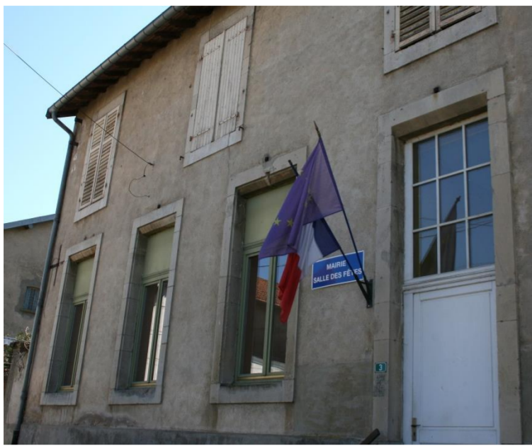
La salle polyvalente