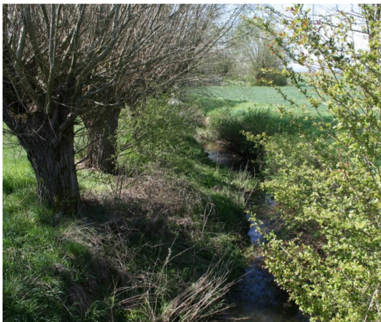
Le ruisseau de l'Etang

Les cinq roses symbolisent les cinq villages rassemblés sous le nom de Belleau, à savoir: Belleau, Lixières, Manoncourt-sur-Seille, Morey et Serrières.