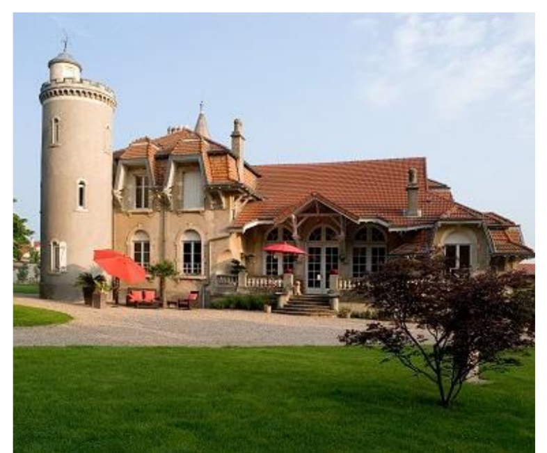
Le château Colin

Le ban de cette commune a dû être occupé après les invasions par une petite colonie franque et prendre le nom du nouveau propriétaire, « Manno ».