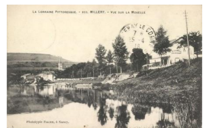
Vue sur la Moselle