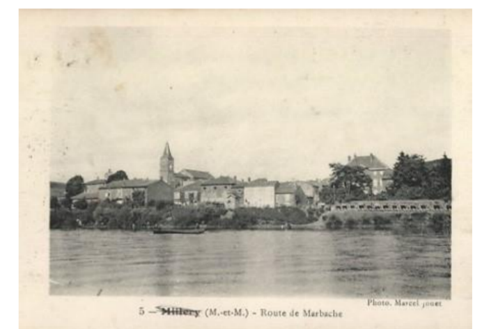
Route de Marbache

Arrondissement: Nancy Canton: Pont à Mousson Entre Seille-et-Meurthe (2015) Maire : Denis Bergerot Mandat : 2014-2020 Code Insee: 54369 Code postal: 54670 Population: 649 habitants Superficie: 7,13 km 2