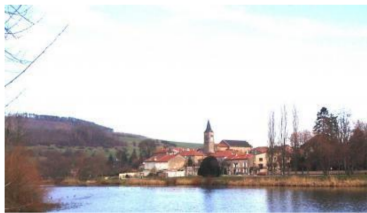
Vu du village

La croix pattée rappelle qu'il y avait à Millery une maison du temple, la commune s'appelait d'ailleurs Millery aux Templiers. Les raisins évoquent l'existence de vignes abondantes au siècle dernier.