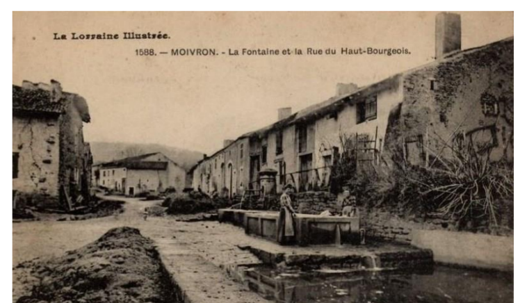
La Fontaine et la Rue du Haut-Bourgeois

Dans les registres de l'abbaye de Gorze le village était nommé Montem Vironem cum Ecclesia De 757 à 1900 il y eu une dizaine d'appellations différentes. Ses habitants sont appelés les Moivronnais et les Moivronnaises