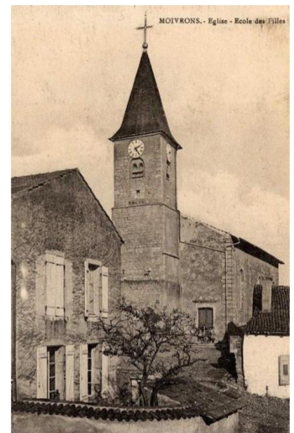
Eglise St Gorgon

Le village de Moivrons se situe en Meurthe-et-Moselle, à une quinzaine de kilomètres au nord-est de Nancy.