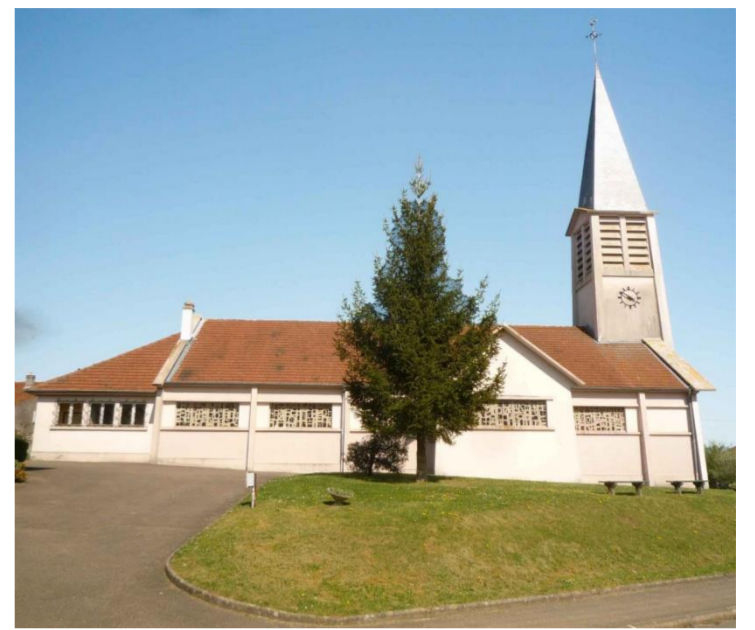
Eglise Saint Gorgon

D'azur à un Saint Gorgon à cheval de pied en cap et terrassé d'or au chef d'argent chargé d'un tau de sable