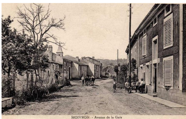
Avenue de la Gare

L'église Saint Gorgon de Moivrons en grande partie détruite pendant la guerre fut reconstruite après 1945 le village est sinistré à 85% en 1944