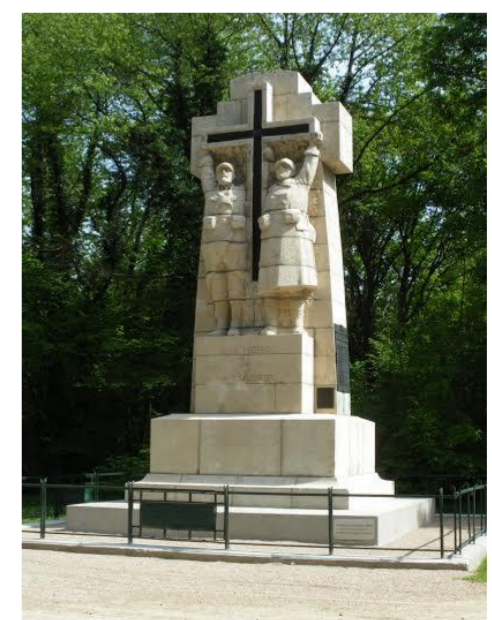
Croix des Carmes