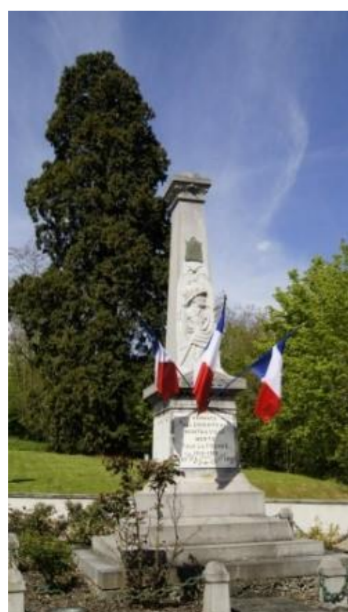
Monument aux morts

Montauville : Montoiville, Montoville. « Mundoaldo villa » : grand domaine agricole, ensemble foncier, unité d'exploitation rurale ou autre explication Montensis « de montagne » et villa « ferme ». Patronne : sainte Madeleine.