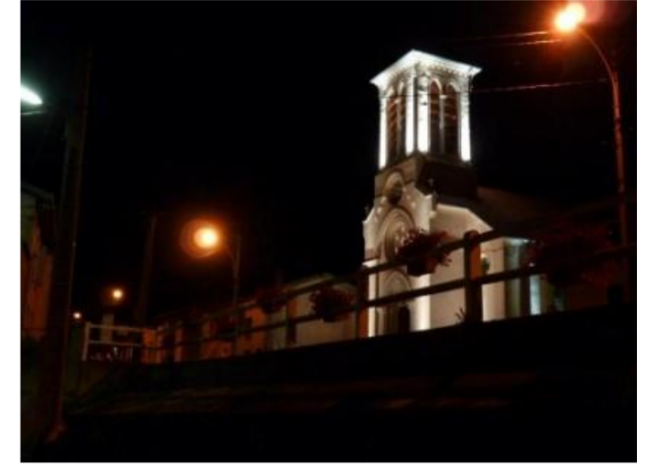
L'église S e Marie-Madeleine

Tranché au 1 o de sinople au chef d'argent à trois lances d'or brochant sur le tout; Au 2 o d'or à la bande de gueules chargée de trois alérions d'argent.