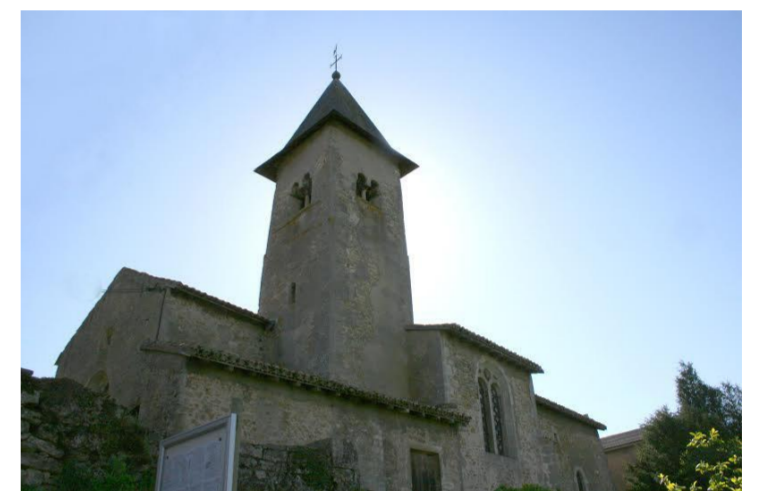
L'église Saint-Pierre et Saint-Paul

Le village de Morey est situé entre deux côtes, à 305 mètres d'altitude environ, sur la rive gauche de la rivière La Natagne affluent de la Moselle. D'une surface de 330 hectares, il s'étage sur le flanc d'un coteau. Le plateau calcaire est occupé par la forêt (Bois du Buzion, Bois de la Rumont, Bois du Chapître). Le village est implanté sur la ligne des sources à mi-pente, puis se succèdent vergers et prairies suivies des terres labourables sur les pentes argileuses qui descendent sur la rivière.