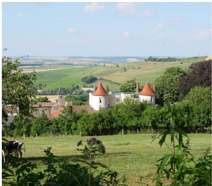
Vue de Morey

Les cinq roses symbolisent les cinq villages rassemblés sous le nom de Belleau, à savoir: Belleau, Lixières, Manoncourt-sur-Seille, Morey et Serrières.