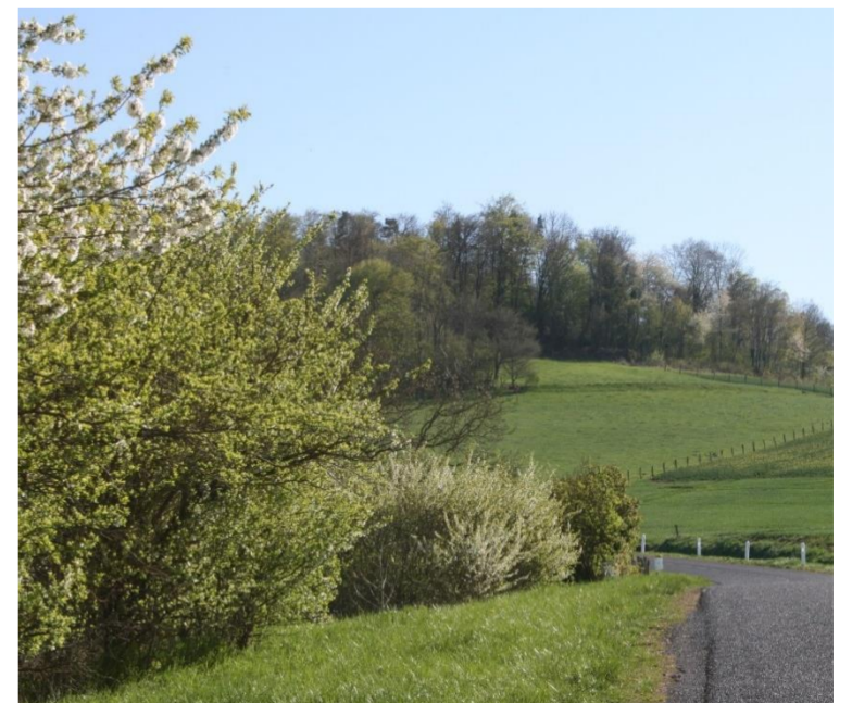
Paysage depuis la D44A

Son nom vient probablement d'un patronyme franc, Maurius « fils de Maurus », et du suffixe iacum, c'est à dire domaine.