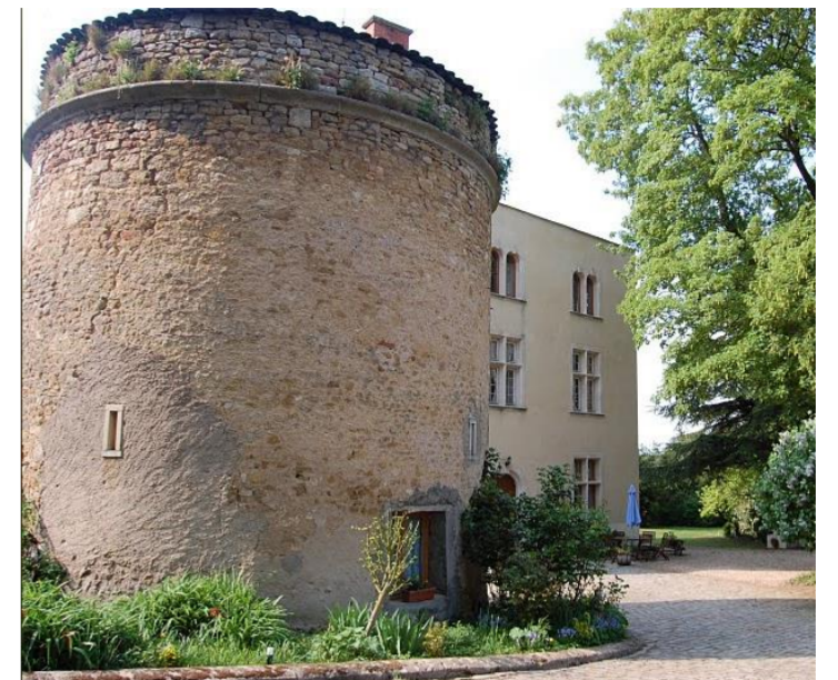
Le château et son pigeonnier

De gueules à cinq roses d'argent, boutonnées de gueules et ordonnées en sautoir (1986)