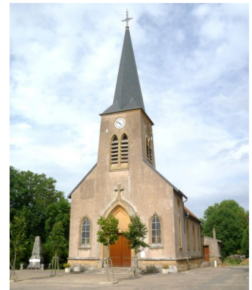
Eglise St Pierre

D'azur à l'aigle d'or chargé d'une fasce ondée d'argent