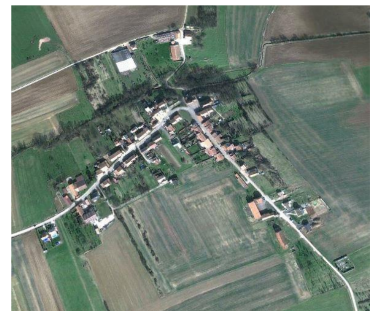
Une vue du ciel en mars 2011

Au XVII ème siècle, les jurements et blasphèmes étaient punis d'une amende de 5 francs la 1 ère fois, le double la 2 ème triple la 3 ème à la 4 ème c'était le châtiment corporel.