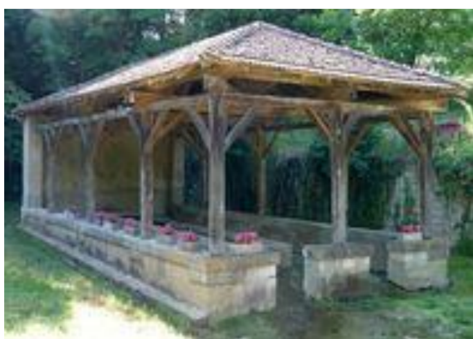
Le lavoir monumental du XIX e