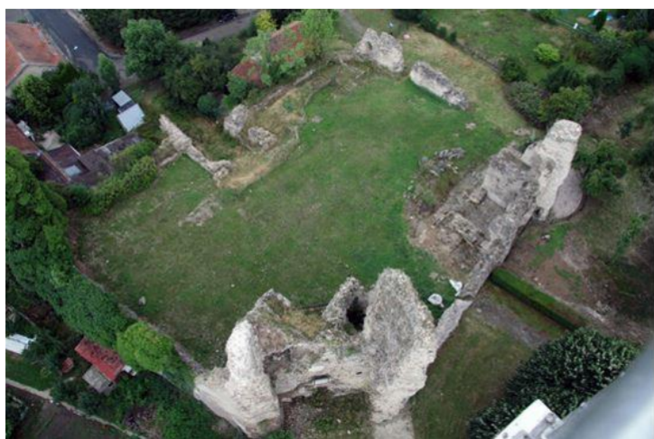
Le château vu du ciel