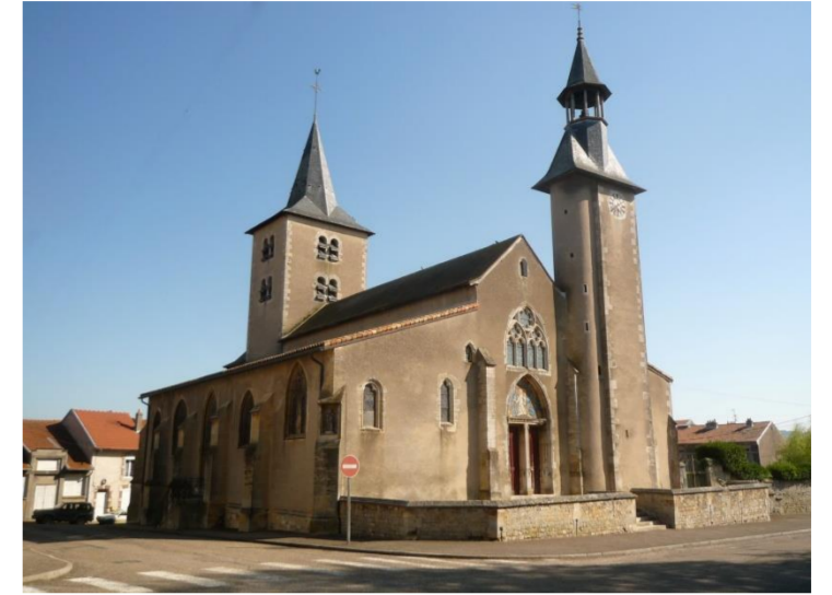
Eglise Saint Etienne

D'azur à la croix recroisettée d'or de montant en chef de deux pièces.