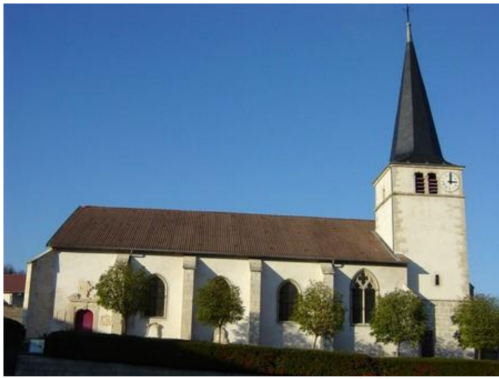
Eglise Saint Rémy