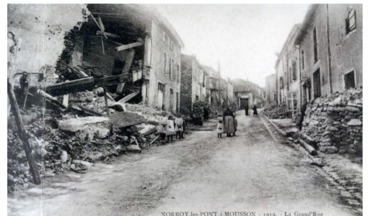
La Grand' Rue en 1919

Depuis novembre 2013, un nouveau bâtiment a vu le jour à côté du groupe scolaire pour accueillir le périscolaire et la nouvelle cantine