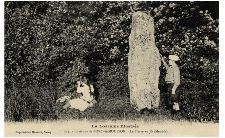
La Pierre au Jô

De gueules au pont à trois arches d'argent flanqué de deux tours couvertes de même, le tout posé sur une rivière