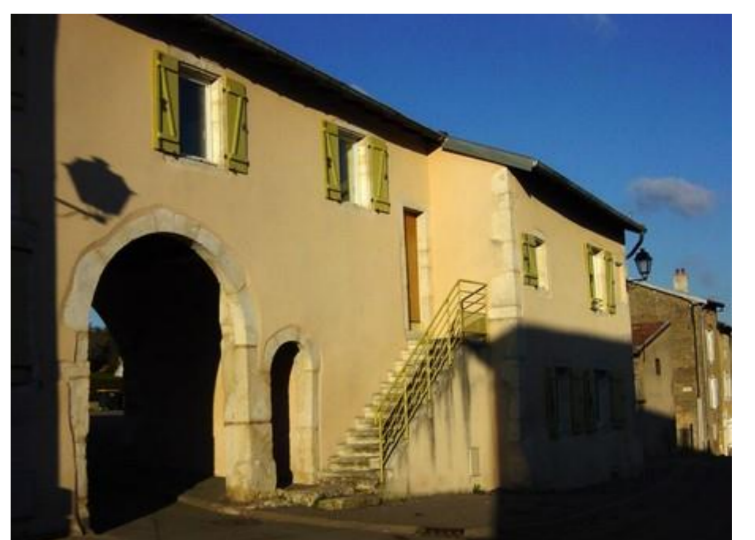
Porche d'entrée de la cour du château