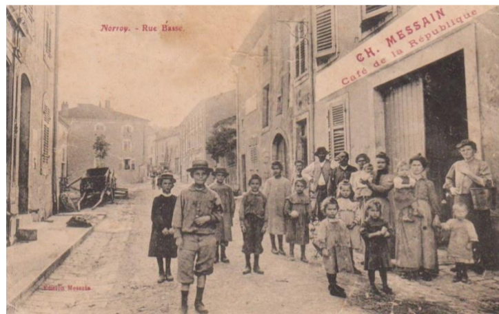
Rue Basse vers 1900

De sinople mouvant de la pointe, au noyer arraché d'or brochant sur le tout.