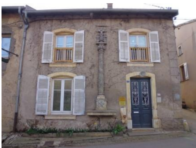
Maison XVIII e siècle rue de Gorze