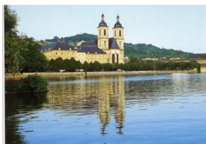
Abbaye des Prémontrés