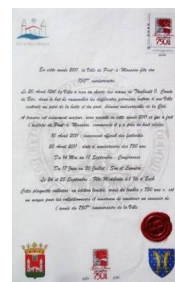
Charte 20 avril 1261