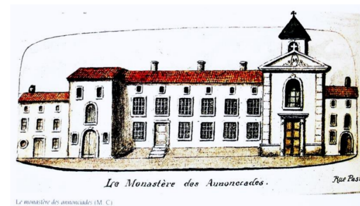
Le monastère des Annonciades