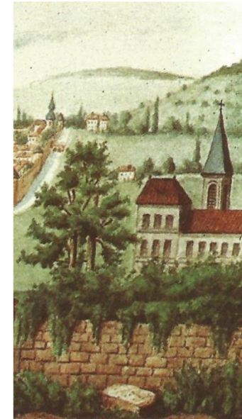
Eglise Haut-de-Rieupt (1714)

La paroisse Sainte-Croix-en-Rieupt , qu'il ne faut pas confondre avec la collégiale Sainte-Croix, avait été fondée, lors des grands travaux du comte Thibaut II, par les habitants de Rieupt et de Maidières venus fixer leur demeure à l'abri des murailles du nord de la Ville Neuve, proches du château ducal.