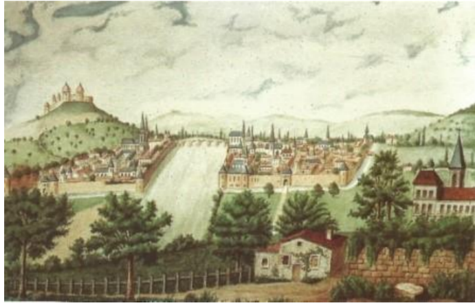
les Carmes déchaussés de Montrichard