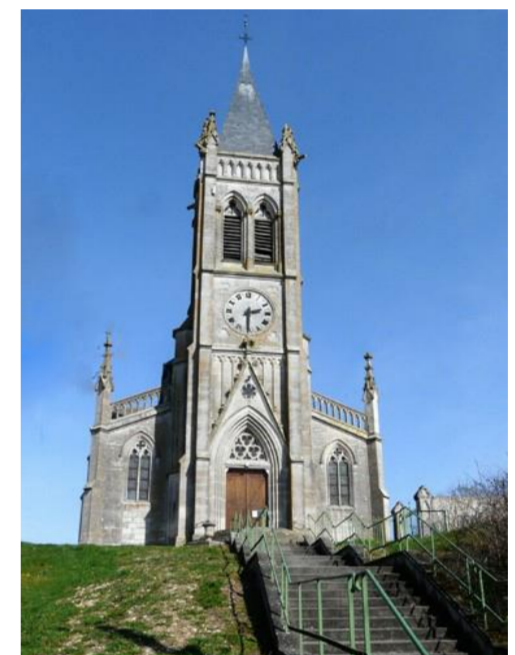
Eglise Saint Rémy

Pannes, petit village de Meurthe-et-Moselle, à la limite de la Meuse, est situé entre 210 et 249 m d'altitude. Ses habitants sont appelés les Pounats et les Pounates. Ce village existait déjà à l'époque romaine, de nombreux objets ayant été retrouvés lors de divers chantiers.