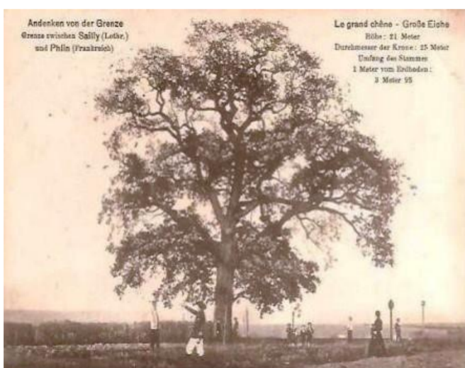
Le grand chêne

Phlin s'est appelée successivement Filicionis curtis (775), Filis (1158), Félix (1261), Félin (1243), Félin en Saulnois (1333), Felain (1463), Phelin (1487), Flin ou Félin (1530), Flin (1801) et ensuite Phlin.