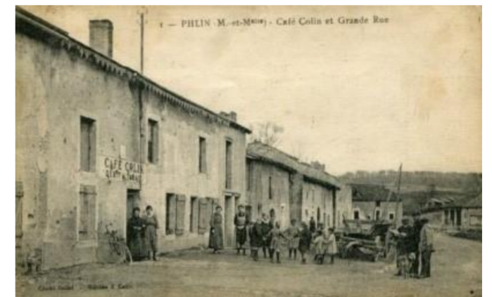
Café Collin et Grande Rue

Phlin est un village français, situé dans le département de la Meurthe-et-Moselle et la région de Lorraine.