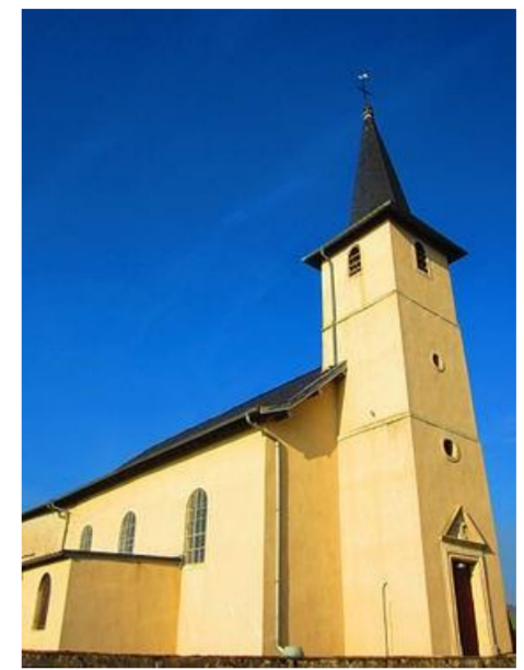
Église de l'Assomption

D'hermine au lion de gueules, armé, lampassé et couronné d'or.