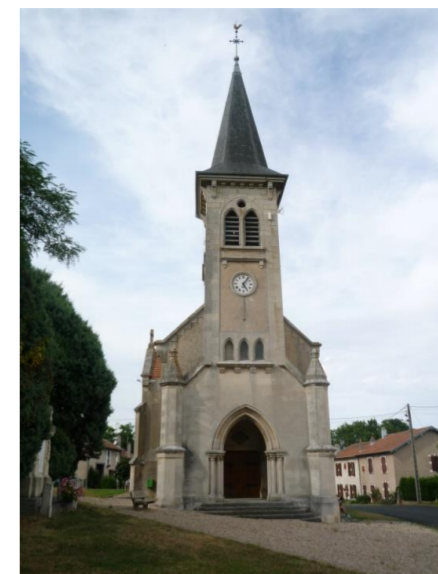
Notre Dame de l'Assomption

Parti au 1° d'azur au chef d'or chargé d'un lion naissant armé lampassé et couronné de gueules ; au 2° d'or à la croix de gueules au franc quartier d'argent chargé d'un lion de sable armé et lampassé de gueules et couronné d'or.