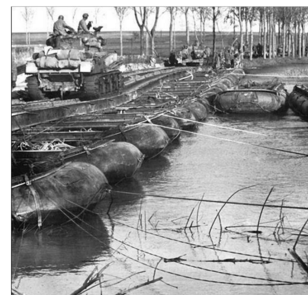
Les américains traversent la Seille

Au musée lorrain de Nancy, sont dix grandes tombes de la famille de Nouroy de la branche des Chérissey, venant des chapelles de l'église au XIV e siècle.