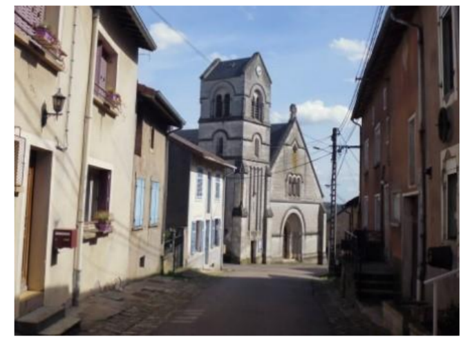
Rue des Remparts et église

D'azur à la tour d'argent maçonnée et ajourée de sable sur une montagne de sinople, accompagnée en chef d'un alérion d'or. Il s'agit du blason de Prény, déjà utilisé en 1608, qui représente la tour de Mandeguerre pourvue d'une cloche d'alerte. Le nom de Prény servait de cri de guerre aux ducs de Lorraine: Priny! Priny!