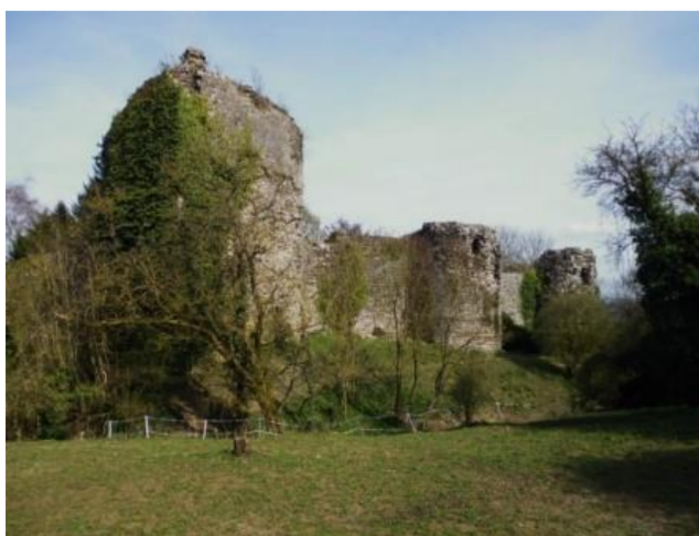
Ruines du château médiéval