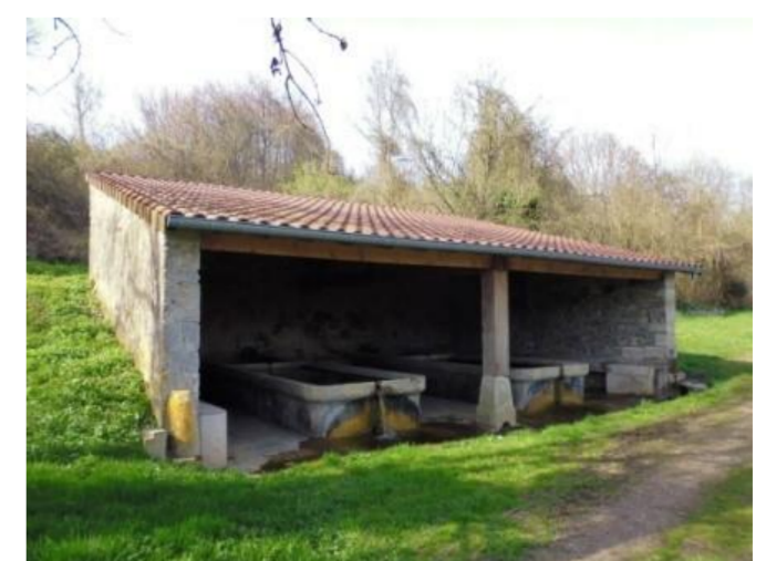
Le Grand Lavoir