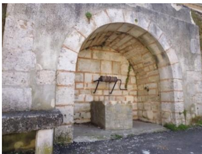
Puits rue Mandeguerre

D'azur à la tour d'argent maçonnée et ajourée de sable sur une montagne de sinople, accompagnée en chef d'un alérion d'or. Il s'agit du blason de Prény, déjà utilisé en 1608, qui représente la tour de Mandeguerre pourvue d'une cloche d'alerte. Le nom de Prény servait de cri de guerre aux ducs de Lorraine: Priny! Priny!