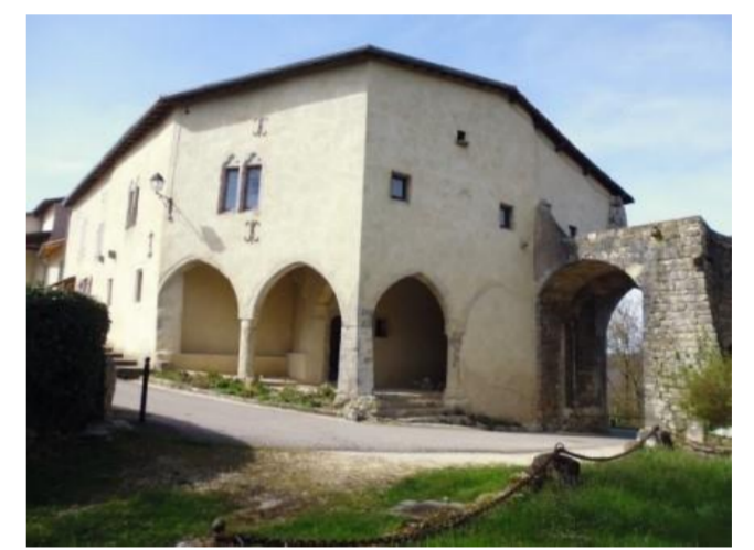
Entrée du Château

Charmant village bâti sur un éperon de la côte de Moselle, Prény, situé en Meurthe-et-Moselle et dans la région de Lorraine, appartient à la communauté de communes du Chardon lorrain. Son territoire, inclus dans le parc naturel régional de Lorraine, est traversé par le ruisseau de Moulon, affluent de la Moselle, et s'étend sur 1509 hectares. La commune, dont l'altitude varie de 185 à 378 m, compte actuellement 375 habitants, les Prénitiens, ce qui représente une densité de 25 hab./km 2 . La population était de 424 âmes en 1831, pour chuter à 249 en 1921, avant d'atteindre un minimum de 157 en 1968. Après un passé viticole totalement disparu au milieu du XX e siècle, les ressources actuelles proviennent surtout de la céréaliculture, de l'élevage et, accessoirement, de l'exploitation forestière.