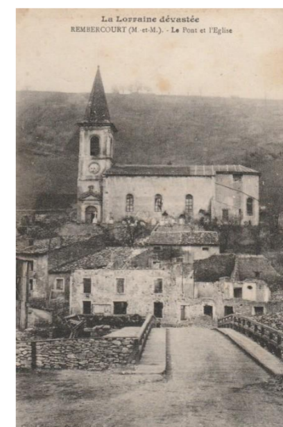
Le Pont et l'Eglise