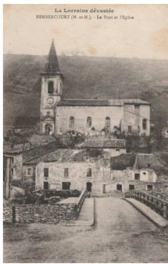
Le Pont et l'Eglise