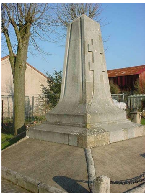
Le monument aux morts

Il s'agit d'armes parlantes, le rouvre est une sorte de chêne. Il est entouré de deux alérions, car la commune dépendait des ducs de Lorraine.