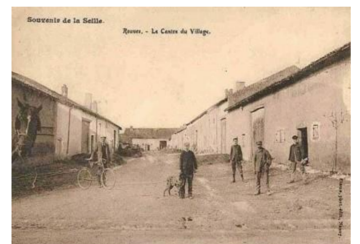
Le centre du village

En 2007, la municipalité a remis en valeur les « usoirs » afin de leurs redonner une certaine convivialité.