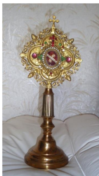
Reliquaire de St Quirin

Rouves (Rouve, 1612) : du latin robur, roborem, chêne rouvre, avec chute du second « R ». Patron : saint Etienne.