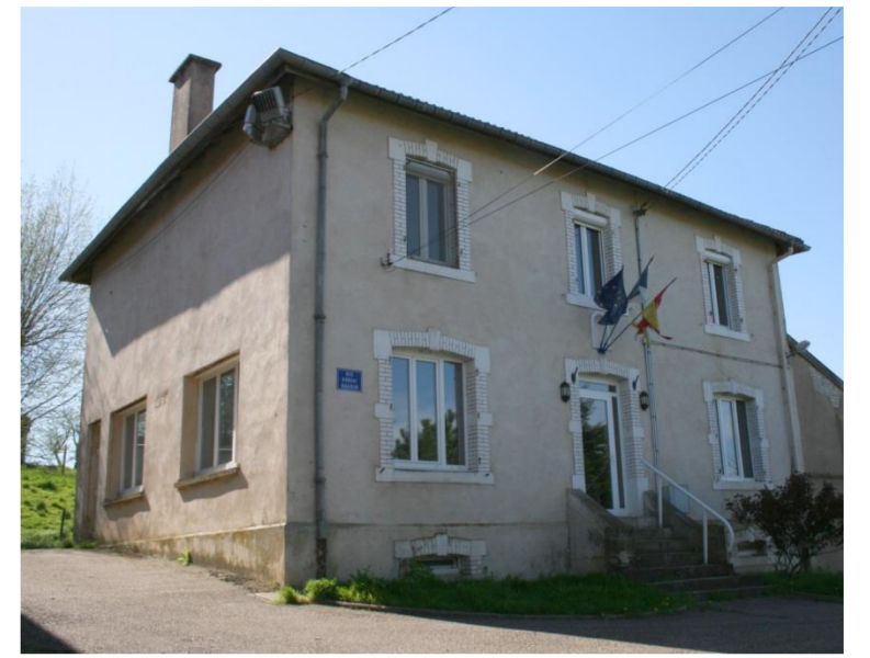
La salle polyvalente

De gueules à cinq roses d'argent, boutonnées de gueules et ordonnées en sautoir (1986)