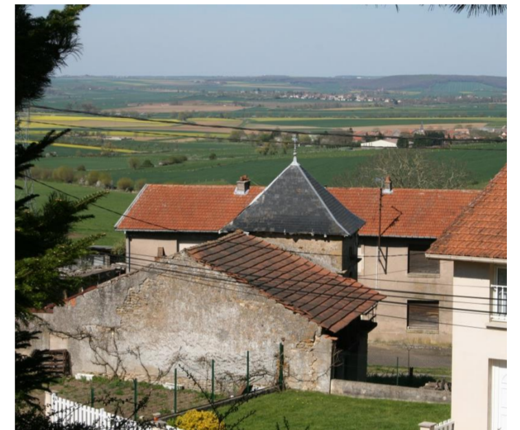
Vue depuis la salle polyvalente

Le village de Serrières est situé au revers d'un coteau, à droite de la Natagne.