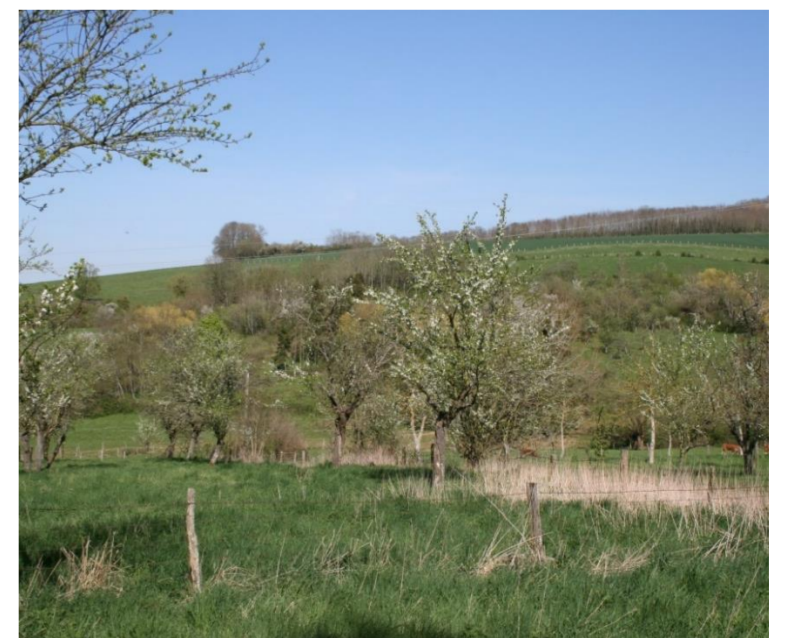
Vue depuis la route de Sivry

La maison de Serrières portait d'or à la croix de gueules, au franc-quartier, chargé d'un lion de sable, armé, lampassé et couronné de gueules.