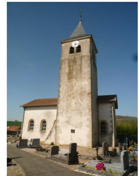
Eglise Saint Nicolas

D'azur à la croix d'argent, brisée d'un lambel à trois pendants de gueules.