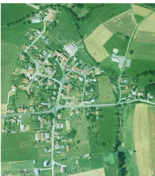
Sivry vu du ciel

Église moderne au XX e siècle avec sa tour du XIX e est conservée