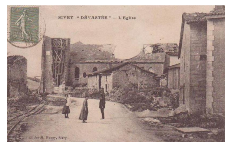
Sivry "Dévastée" L'église

Les habitants de Sivry sont les Sivriens et les Sivriennes