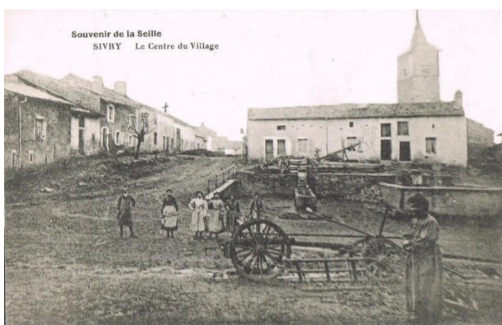
Le centre du village

Ce sont les armes de la famille de Toulon, d'ancienne chevalerie, dont le château était situé sur le mont Toulon, colline qui surplombe Sivry et fait partie de cette même commune. Ce lignage de Toulon s'éteignit au XVI e siècle. Le blason est utilisé par la commune depuis 1986.