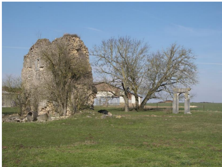
Vestiges du donjon.

Tiercé en pal au 1° de sable à trois anneaux d'or en pal, au 2° d'argent à trois bandes de gueules, au 3° d'azur à trois mouchetures d'hermine d'argent en pal